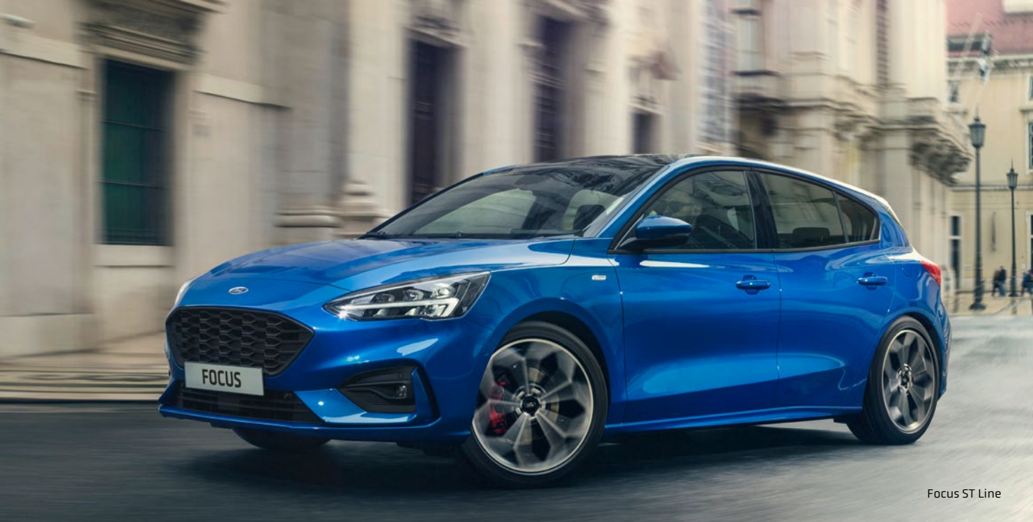
Focus ST Line