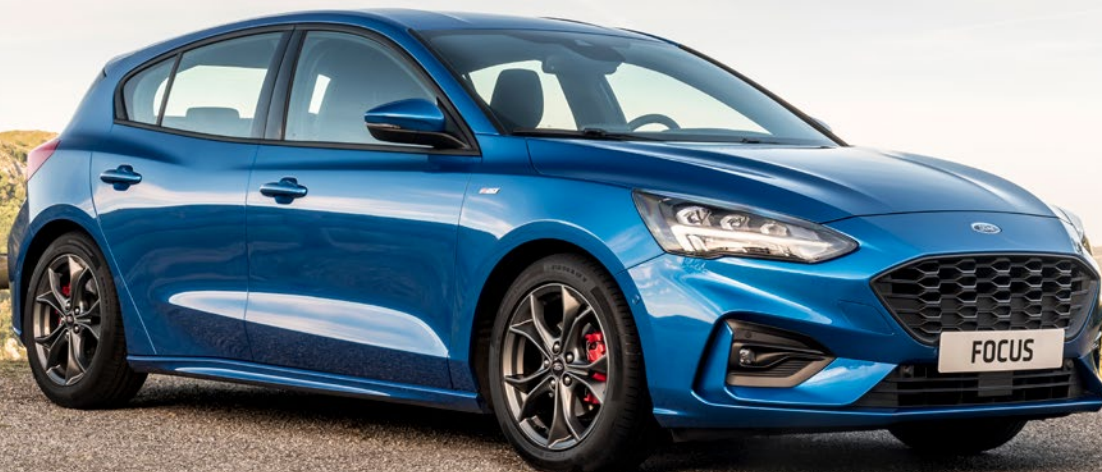
Focus ST Line

*Nettoprijs, inclusief recyclagepremie indien van toepassing