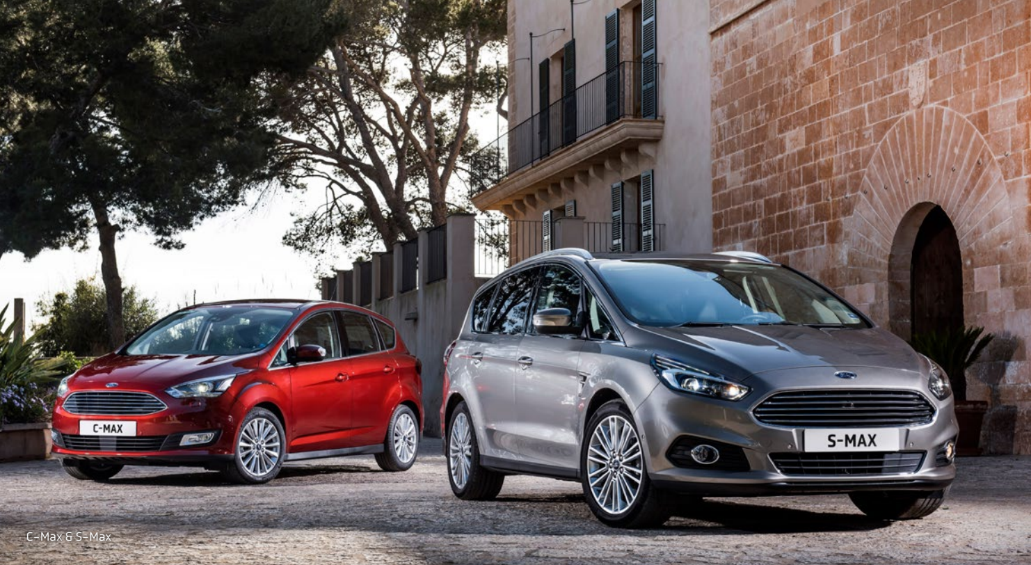
C-Max & S-Max