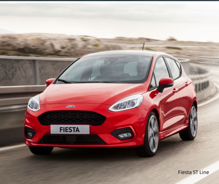
Fiesta ST Line