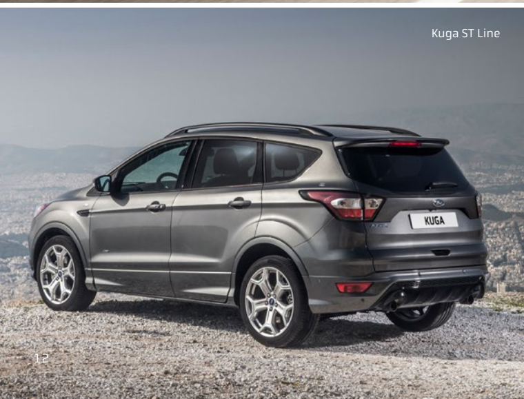
Kuga ST Line