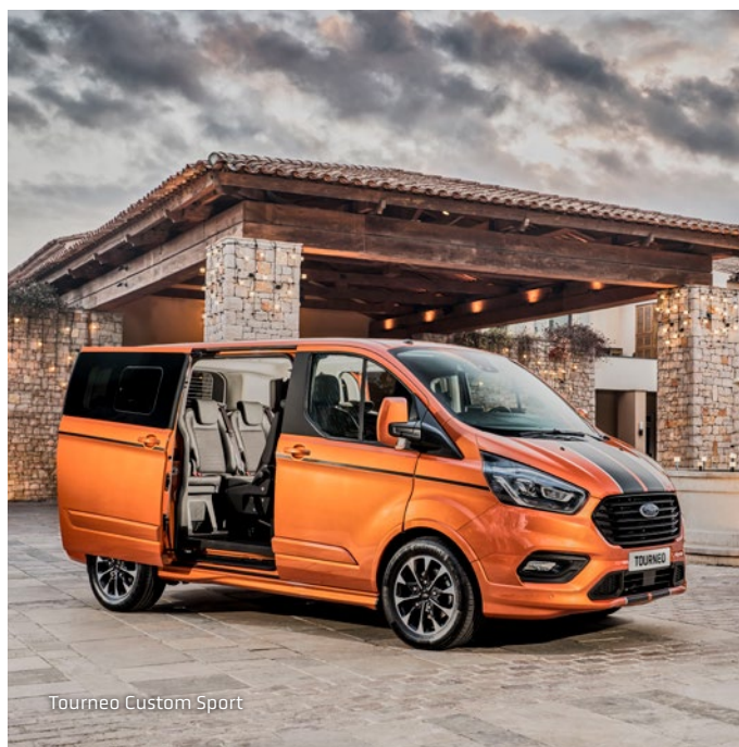
Tourneo Custom Sport