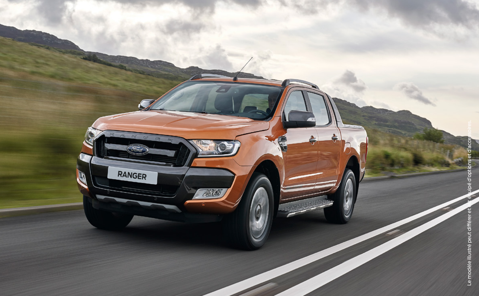
Le modèle illustré peut différer et être équipé d'options et d'accessoires.