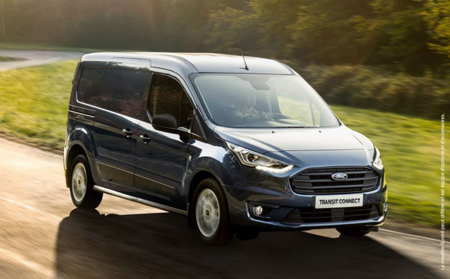
Le modèle illustré peut différer et est équipé d'options et d'accessoires.