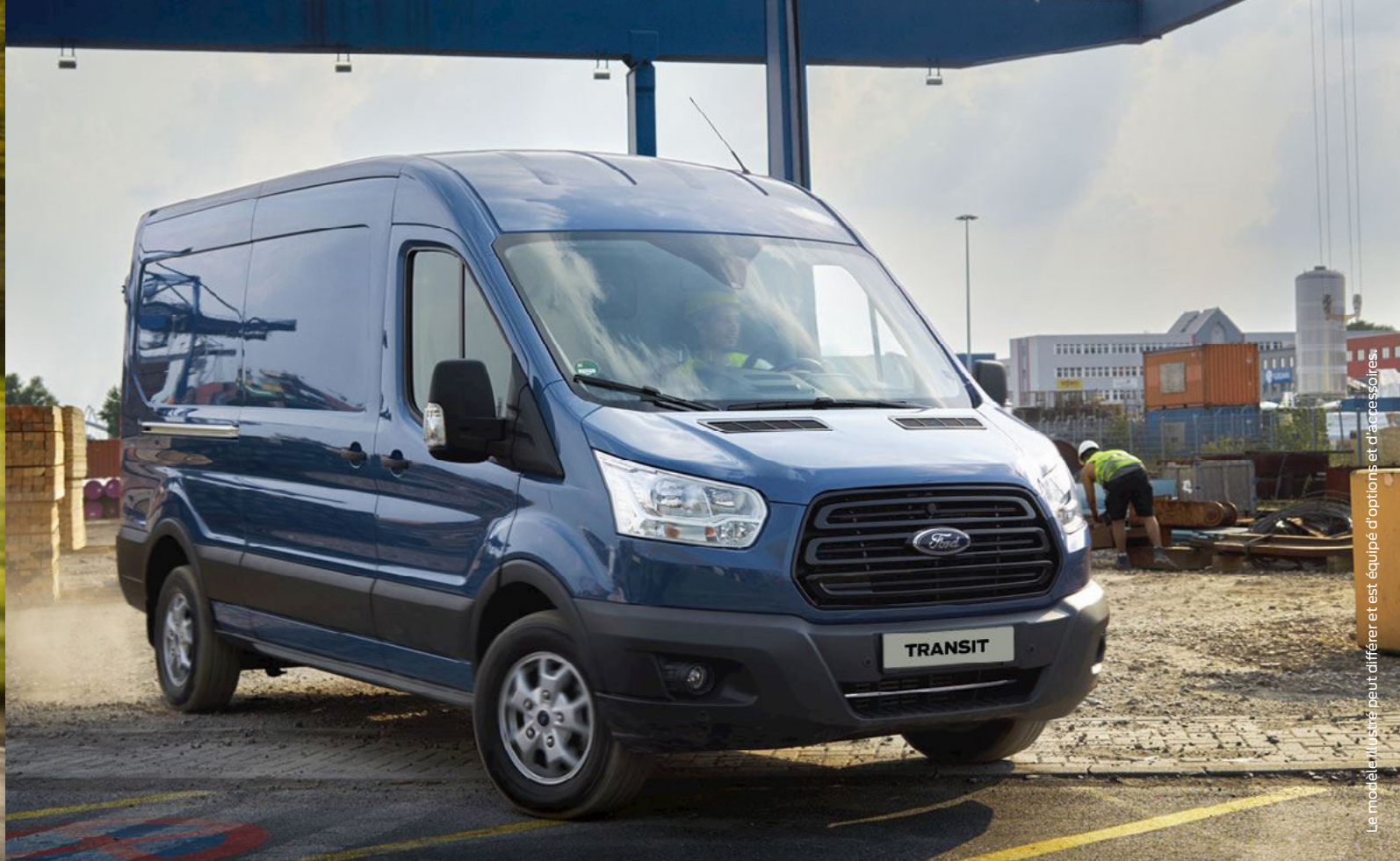
Le modèle illustré peut différer et est équipé d'options et d'accessoires.

4,7-6,4 L/100KM. 123-146 G/KM. (CO 2 MPAS)