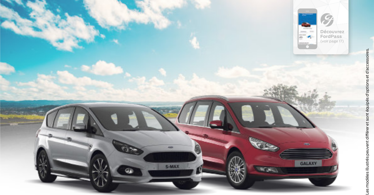
Les modèles illustrés peuvent différer et sont équipés d'options et d'accessoires.