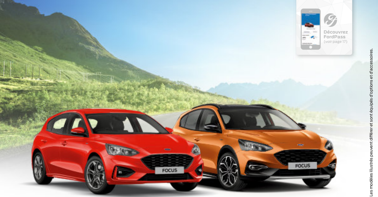
Les modèles illustrés peuvent différer et sont équipés d'options et d'accessoires.