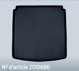
N° d'article 2130686