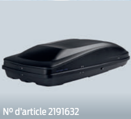
N° d'article 2191632

Préparez-vous à un hiver neigeux. Rendez-vous sur www.ford-accessoires.ch ou équipez-vous chez votre partenaire Ford.