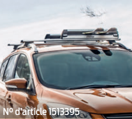
N° d'article 1513395