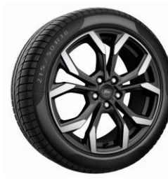
18" ST-Line X Standard