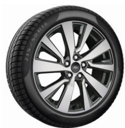
18" Titanium X Standard