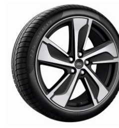
19" ST-Line X Külső Dizájn csomagban érhető el