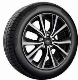
17" Titanium/Freedom limitált széria* Standard

2022.75-ös modellév - 2022/4 Érvényes: 2022. július 25-i számlázástól A változtatás jogát fenntartjuk!