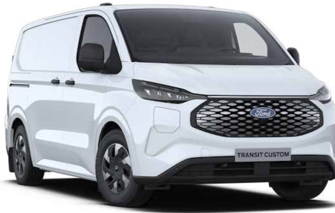
Afbeelding wijkt af: LED Coast-to-coast lichtbalk niet beschikbaar en velgen optioneel. Diamond grille in zwart.