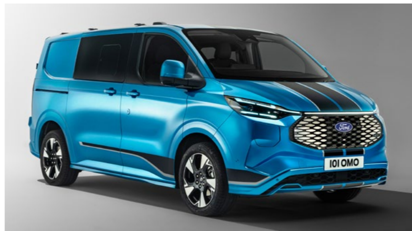
Grille en koplampen wijken af van afbeelding