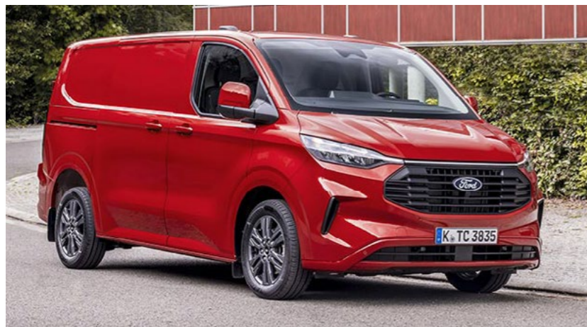
Grille wijkt af van afbeelding