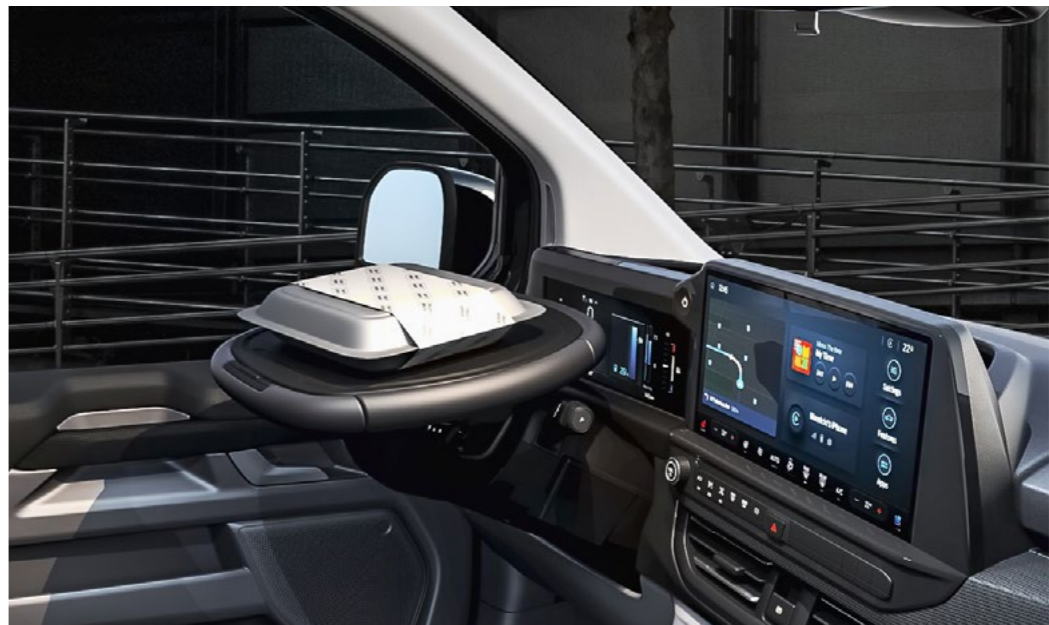
Afgebeeld: Mobile Office Pack