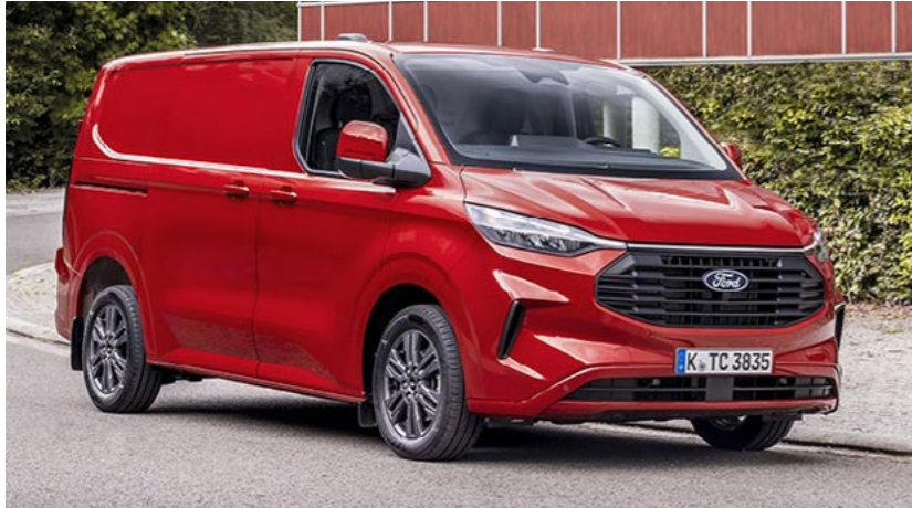
Grille wijkt af van afbeelding