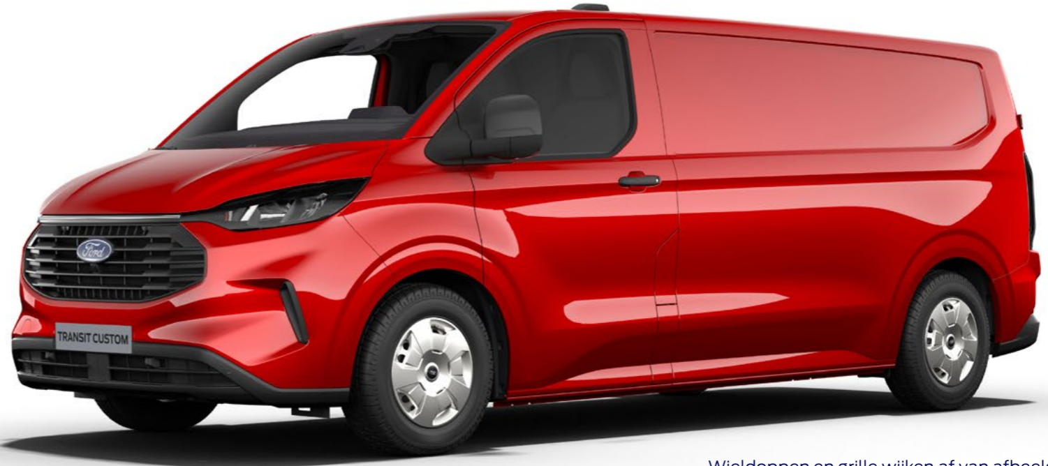
Wieldoppen en grille wijken af van afbeelding