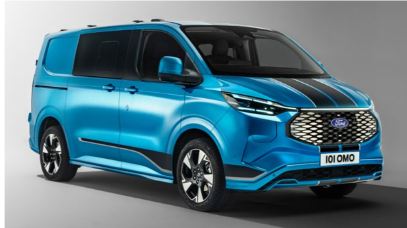
Grille en koplampen wijken af van afbeelding