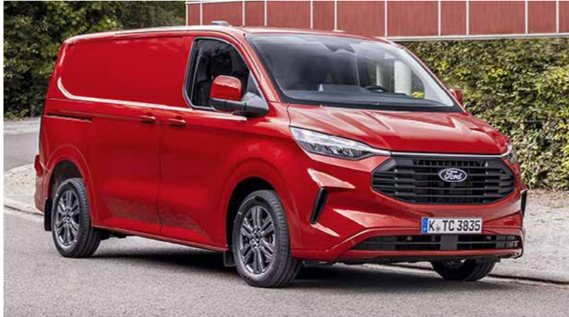
Grille wijkt af van afbeelding. Velgen zijn optioneel