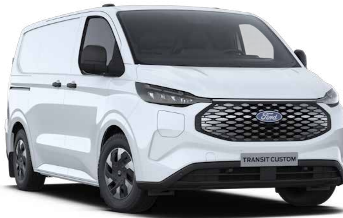
Afbeelding wijkt af: LED Coast-to-coast lichtbalk niet beschikbaar en velgen optioneel. Diamond grille in zwart.