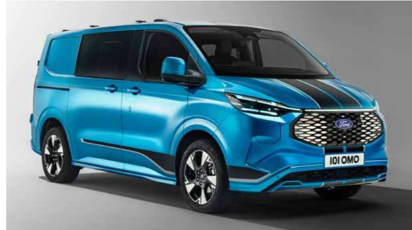
Koplampen wijken af van afbeelding. Velgen zijn optioneel