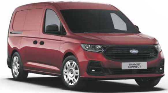
Maple Red metallic lak