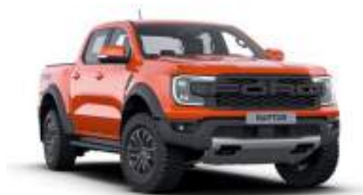
CODE ORANGE - lakier metalizowany 3 200 zł