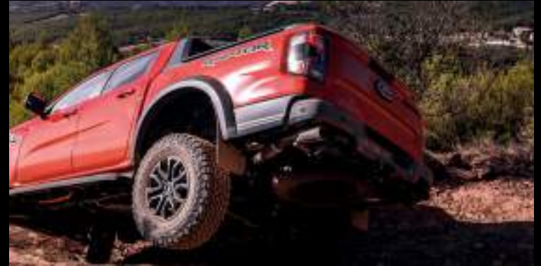
Opony terenowe AT - wyposażenie standardowe wersji Raptor