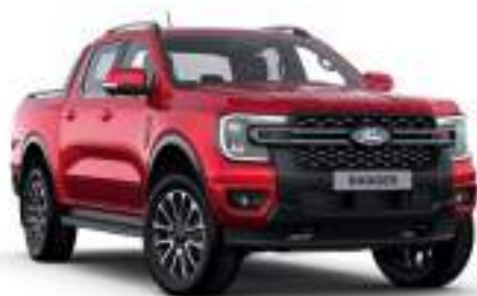
LUCID RED - lakier specjalny 3 700 zł Lakier niedostępny dla wersji Wildtrak, MS-RT