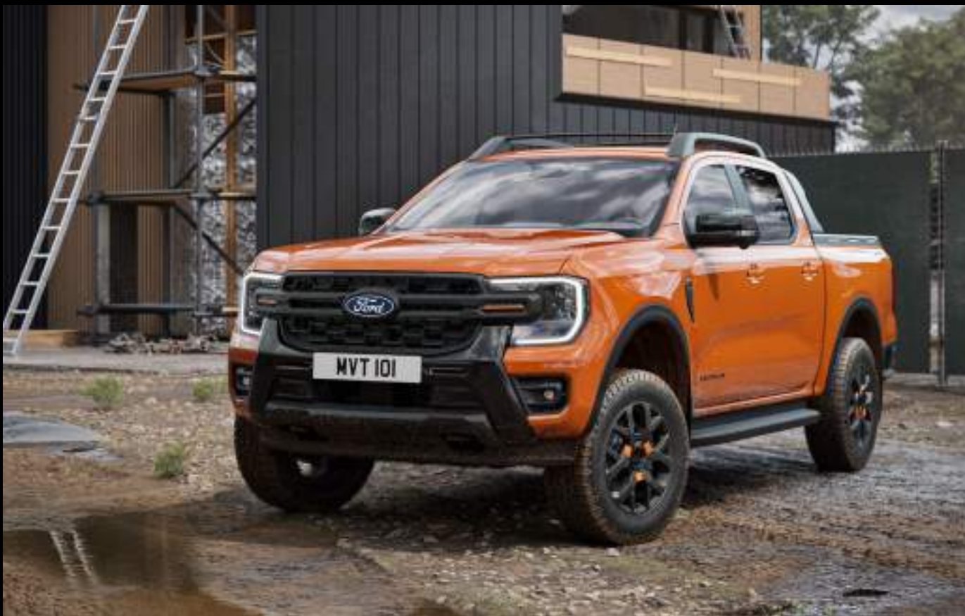
Ford Ranger® w wersji Wildtrak z silnikiem 3.0 EcoBlue V6. Kolor nadwozia: Ignite Orange (wymaga dopłaty)

Dostępny w sześciu wersjach wyposażenia: gotowej do pracy - XLT, kofortowej - LIMITED, przygodowej - WILDTRAK, ekskluzywnej - PLATINUM, sportowej - MS-RT oraz ekstermalnej - RAPTOR. Poznaj całą gamę Nowego Forda Ranger..