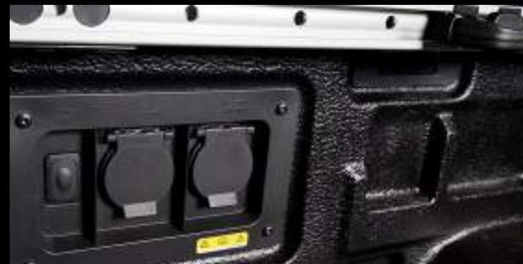
Power On Board - mobilne źródło zasilania (wymaga dopłaty)