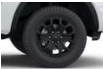
18" obrycze kół ze stopów lekkich (D2UFC) XLT ECOBLUE