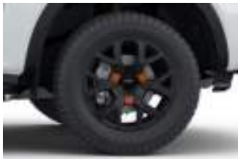
18" obrycze kół ze stopów lekkich (D2ULF) WILDTRAK ECOBLUE