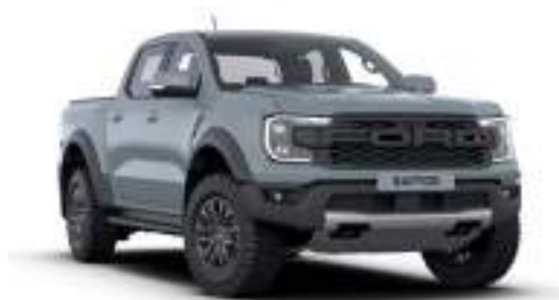
COMMAND GREY - lakier Performance 3 200 zł