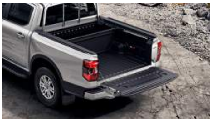
Ruchoma przegroda skrzyni ładunkowej 1 750 zł dla wszystkich wersji z wyjątkiem wersji Raptor