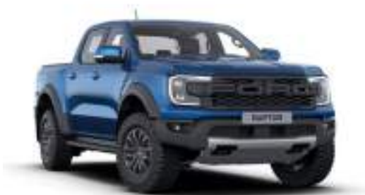
BLUE LIGHTNING - lakier metalizowany 3 200 zł