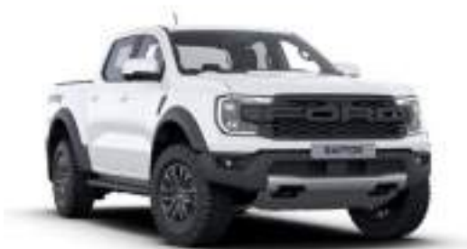
ARTCIC WHITE - lakier zwykły bez dopłaty