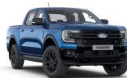
BLUE LIGHTNING - lakier metalizowany 3 200 zł Lakier dostępny tylko dla wersji XLT i Limited