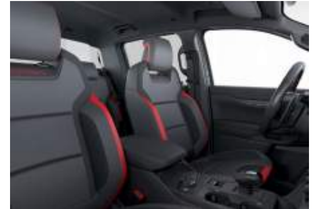
Ford Ranger® w wersji Raptor w kolorze Blue Lightning (wymaga dopłaty) Wnętrze: Tapicerka skórzana w stylizacji Raptor (wyposażenie standardowe)