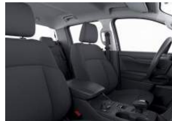
Ford Ranger® w wersji XLT (wersja z napędem PHEV) w kolorze Frozen White (bez dopłaty) Wnętrze: Tapicerka materiałowa (wyposażenie standardowe)