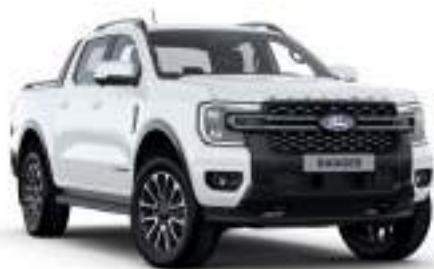
FROZEN WHITE - lakier zwykły bez dopłaty