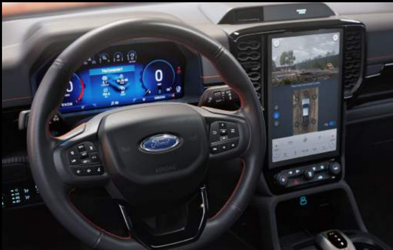
Ford Ranger Wildtrak z opcjonalnym wyposażeniem

System BlueCruise jest wyposażeniem standardowym dla wersji Platinum (PHEV) oraz opcjonalnym dla pozostałych wersji wyposażenia z napędem PHEV.