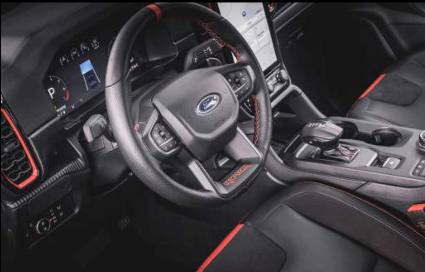
Ford Ranger w wersji Raptor z opcjonalnym wyposażeniem