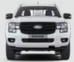
Szerokość całkowita z lusterkami bocznymi: 2208 mm