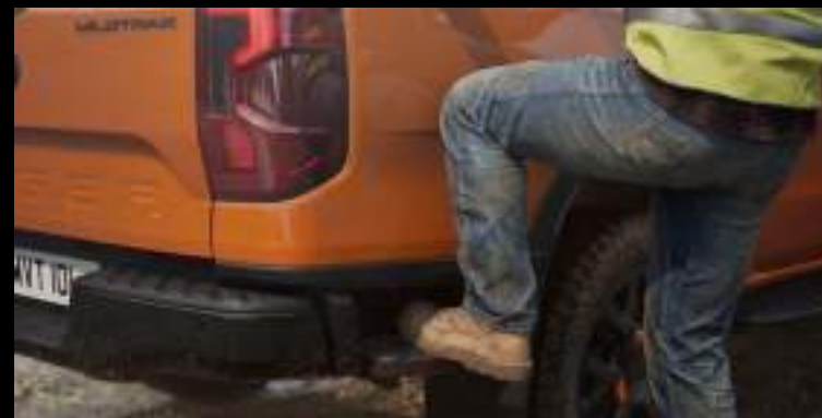
Stopień boczny w tylnym zderzaku

Wyposażenie standardowe wersji Limited, Wildtrak i Platinum