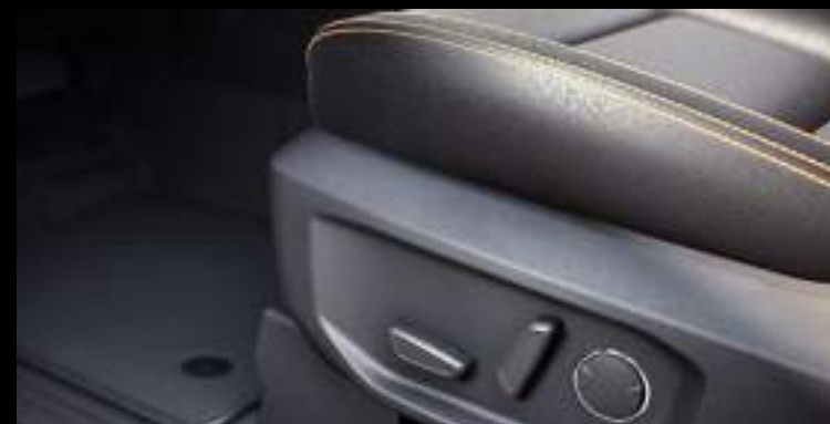
Elektryczna regulacja foteli Wyposażenie standardowe dla wybranych wersji