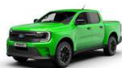
YELLOW GREEN 3 700 zł

Kolory SVO dostępne również dla innych wersji wyposażenia.