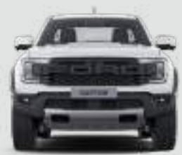
Szerokość całkowita z lusterkami bocznymi: 2208 mm