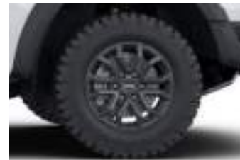
17" obrycze kół ze stopów lekkich (D2YDX) RAPTOR