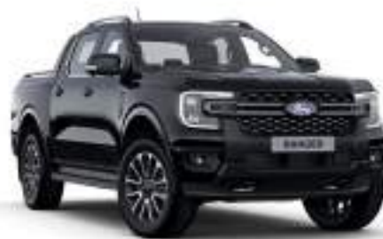
AGATE BLACK - lakier metalizowany 3 200 zł