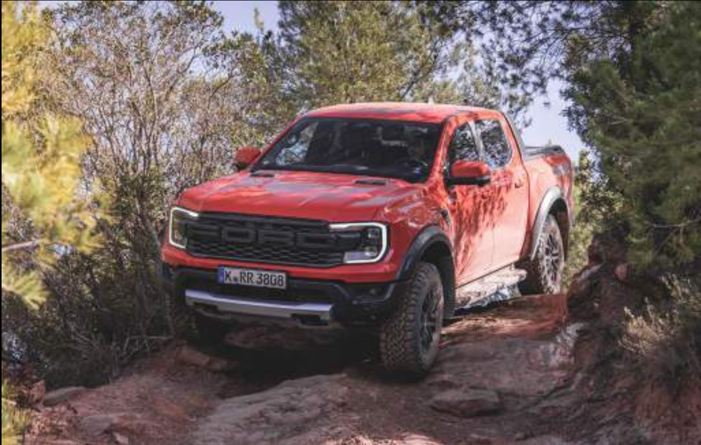
Ford Ranger w wersji Raptor z opcjonalnym wyposażeniem. Kolor nadwozia Code Orange - wymaga dopłaty

Jak przystało na produkt Ford Performance - Nowego Raptora z silnikiem benzynowym wyposażono w system Anti-Lag - jest on dostępny w trybie Baja i zapewnia szybszą reakcję na wciśnięcie pedału przyspieszenia podczas np. wyjścia z zakrętu lub podczas zmiany biegów.