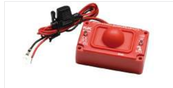
Odstraszacz do kun (2 033 207) 392 zł

Pełną gamę oryginalnych akcesoriów FORD znajdziesz na stronie www.akcesoria-ford.pl . Zapytaj również o aktualne promocje u Swojego Dealera FORDa. Podane ceny są cenami detalicznymi netto. Nie zawierają kosztu montażu. Ceny aktualne na dzień publikacji cennika.