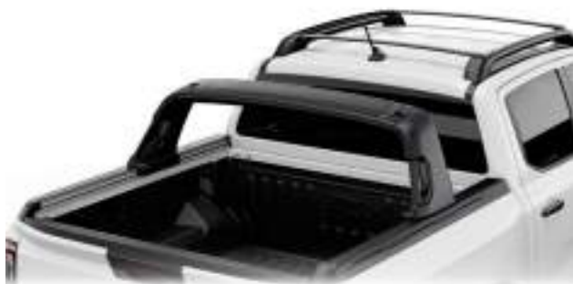
Flexible Rack System - funkcjonalny system mocowania ładunku 10 380 zł dla wersji Limited, Wildtrak, MS-RT