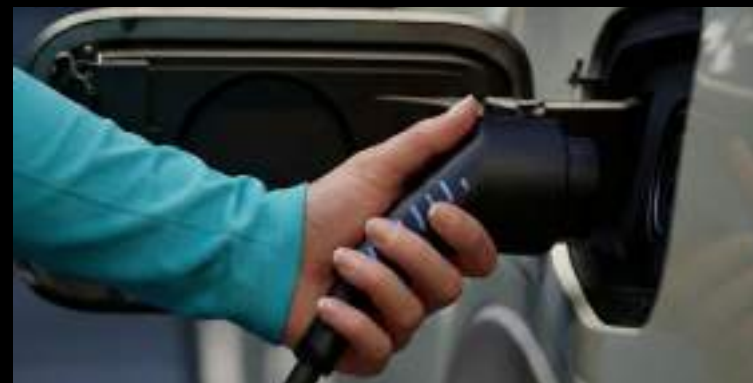
Maksymalny zasięg na silniku elektrycznym to 43 KM