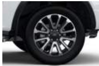
20" obrycze kół ze stopów lekkich (D2FCC) PLATINUM ECOBLUE