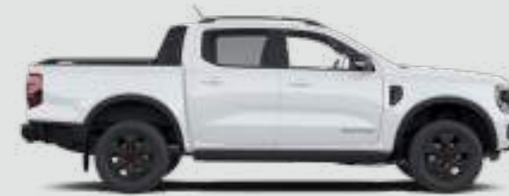
Podwójna kabina Długość całkowita z lusterkami bocznymi: 5370 mm