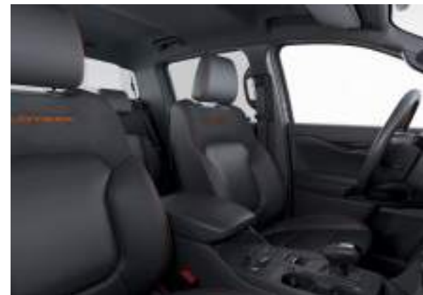
Ford Ranger® w wersji Wildtrak (wersja z silnikiem EcoBlue) w kolorze Ignite Orange (wymaga dopłaty) Wnętrze: Tapicerka częściowo skórzana w stylizacji Wildtrak (wyposażenie standardowe)