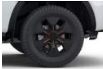
18" obrycze kół ze stopów lekkich (D2UA1) WILDTRAK PHEV