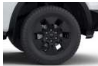
18" obrycze kół ze stopów lekkich (D2UA1) LIMITED PHEV