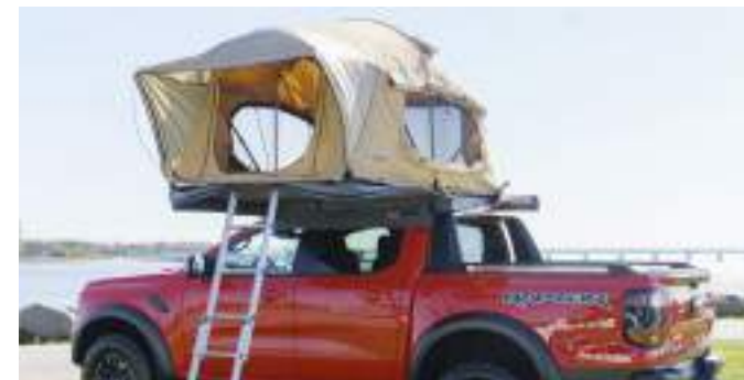
ARB* Namiot dachowy Flinders, z drabinką (2 616 022) 7 880 zł