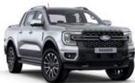
ICONIC SILVER - lakier specjalny 3 200 zł