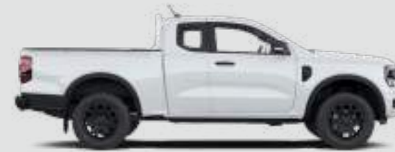
Przedłużona kabina Długość całkowita z lusterkami bocznymi: 5370 mm

Wszystkie wymiary podlegają tolerancjom produkcyjnym i odnoszą się do modeli z minimalnym wyposażeniem i nie obejmują żadnego wyposażenia. Wymiary wersji MS-RT dostępne u Twojego Dealera Ford.