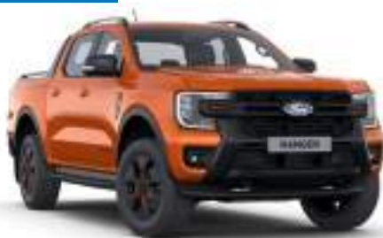
IGNITE ORANGE - lakier SPECJALNY 3 700 zł Lakier dostępny tylko dla wersji Wildtrak