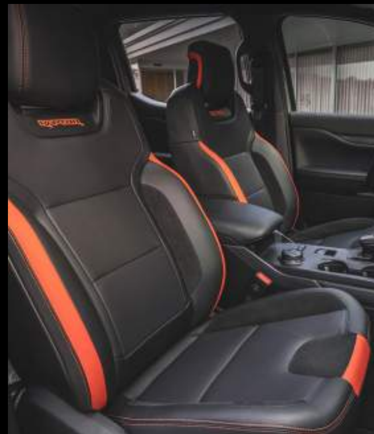
Tapicerka częściowo skórzana - wyposażenie standardowe wersji Raptor