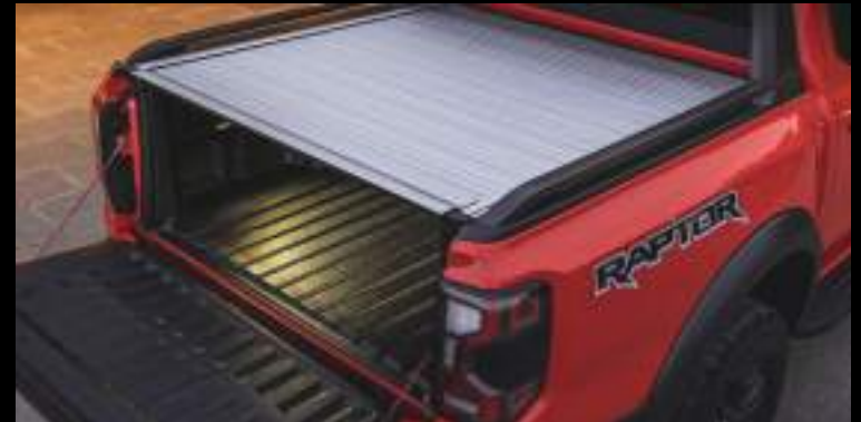
Elektryczna roleta - wymaga dopłaty