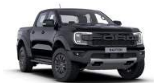
ABSOLUT BLACK - lakier metalizowany 3 200 zł