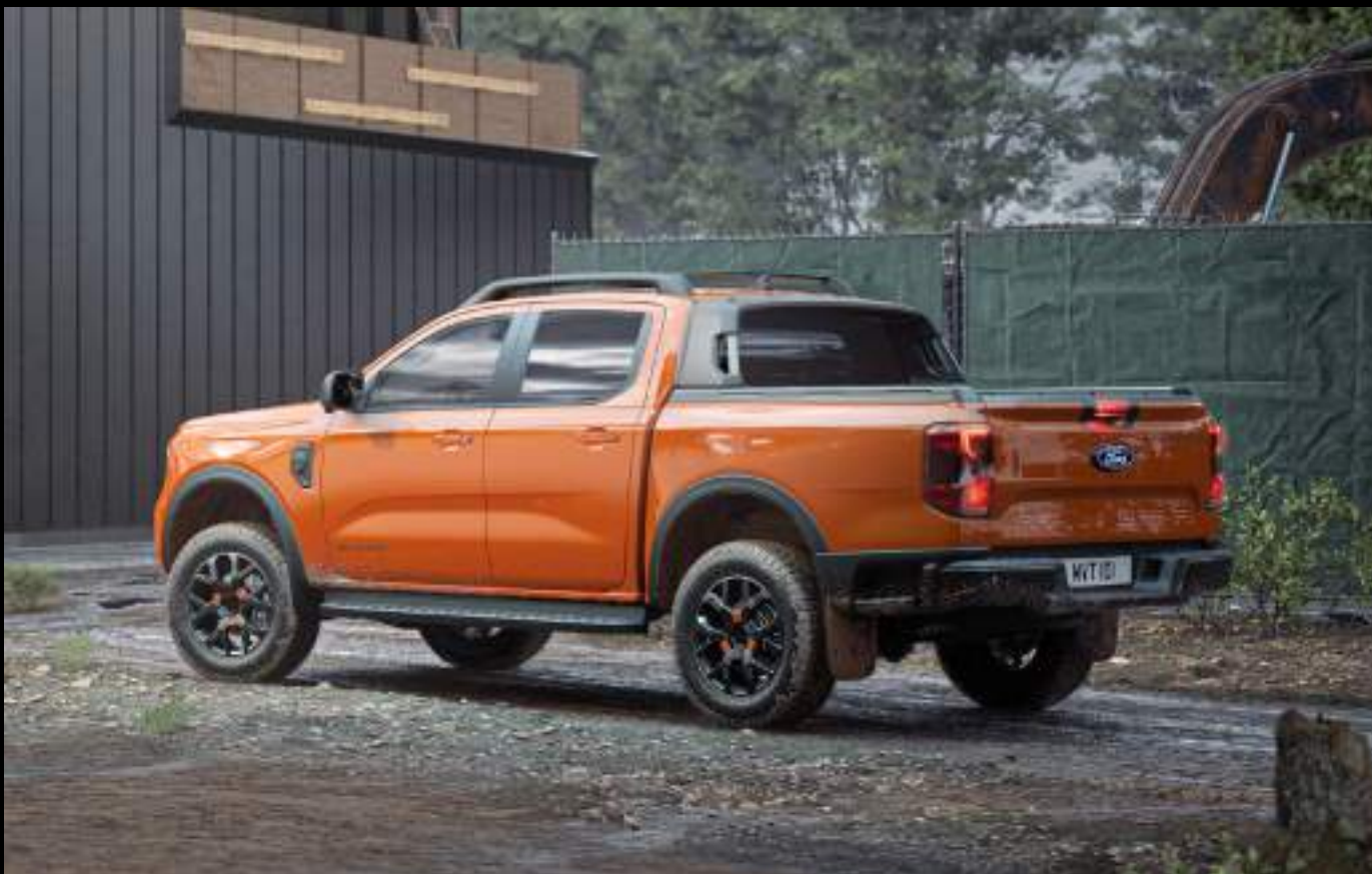
Ford Ranger® w wersji Wildtrak z silnikiem 3.0 EcoBlue V6. Kolor nadwozia: Ignite Orange (wymaga dopłaty)

Najnowszy silnik wysokoprężny V6 3.0 EcoBlue oferuje aż do 240 koni mechanicznych i generuje do 600 Nm momentu obrotowego, a poszerzone nadwozie nadaje Rangerowi większej stabilności w terenie oraz podczas wożenia ładunku, jak i jeszcze bardziej wyrazistego wyglądu. Szersza skrzynia ładunkowa zapewnia dodatkową przestrzeń ładunkową, pozwalającą zmieścić standardową europaletę pomiędzy nadkolami. Skrzynia została wykończona nową, wyprofilowaną wykładziną zapewniającą jej lepszą ochronę przed uszkodzeniami.