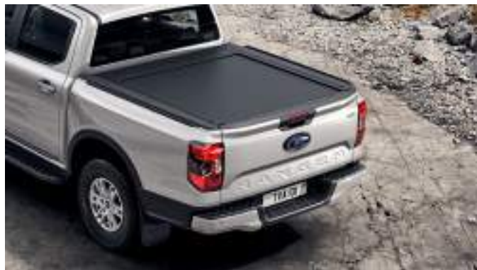
Aluminiowa roleta skrzyni ładunkowej 7 650 zł dla wszystkich wersji z wyjątkiem wersji Raptor