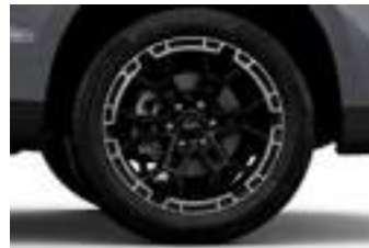
21" obrycze kół ze stopów lekkich MS-RT