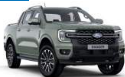
ACACIA GREEN - lakier specjalny 3 700 zł Lakier dostępny tylko dla wersji Platinum