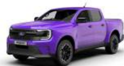
ENW PURPLE 3 700 zł