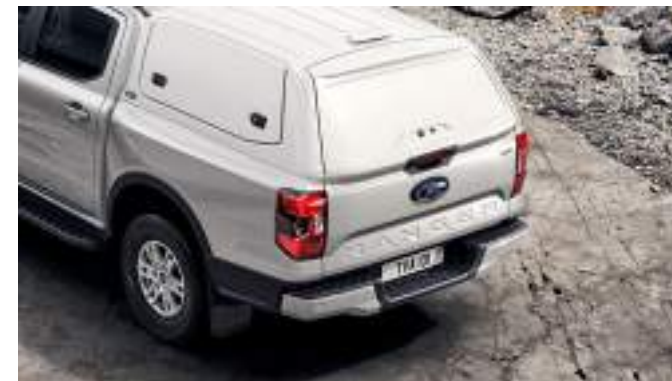
Hardtop bez okiem w kolorze białym 13 200 zł dla wszystkich wersji w wyjątkiem wersji MS-RT i Raptor