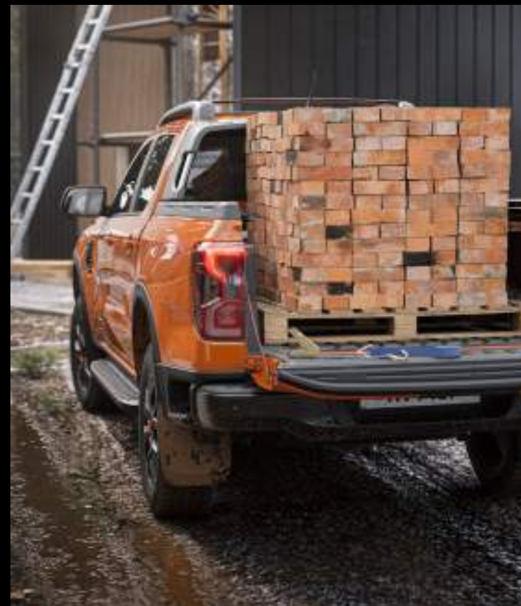
Maksymalna ładowność to 1060 kg dla wersji Limited