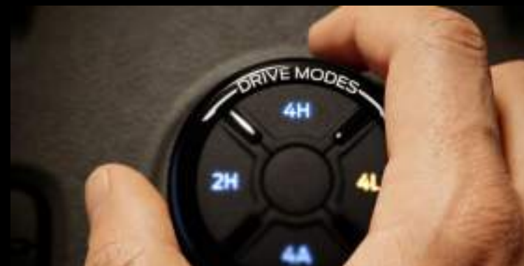
Pokrętko wyboru trybów jazdy Wyposażenie standardowe dla wszystkich wersji