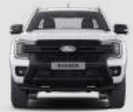
Szerokość całkowita z lusterkami bocznymi: 2208 mm