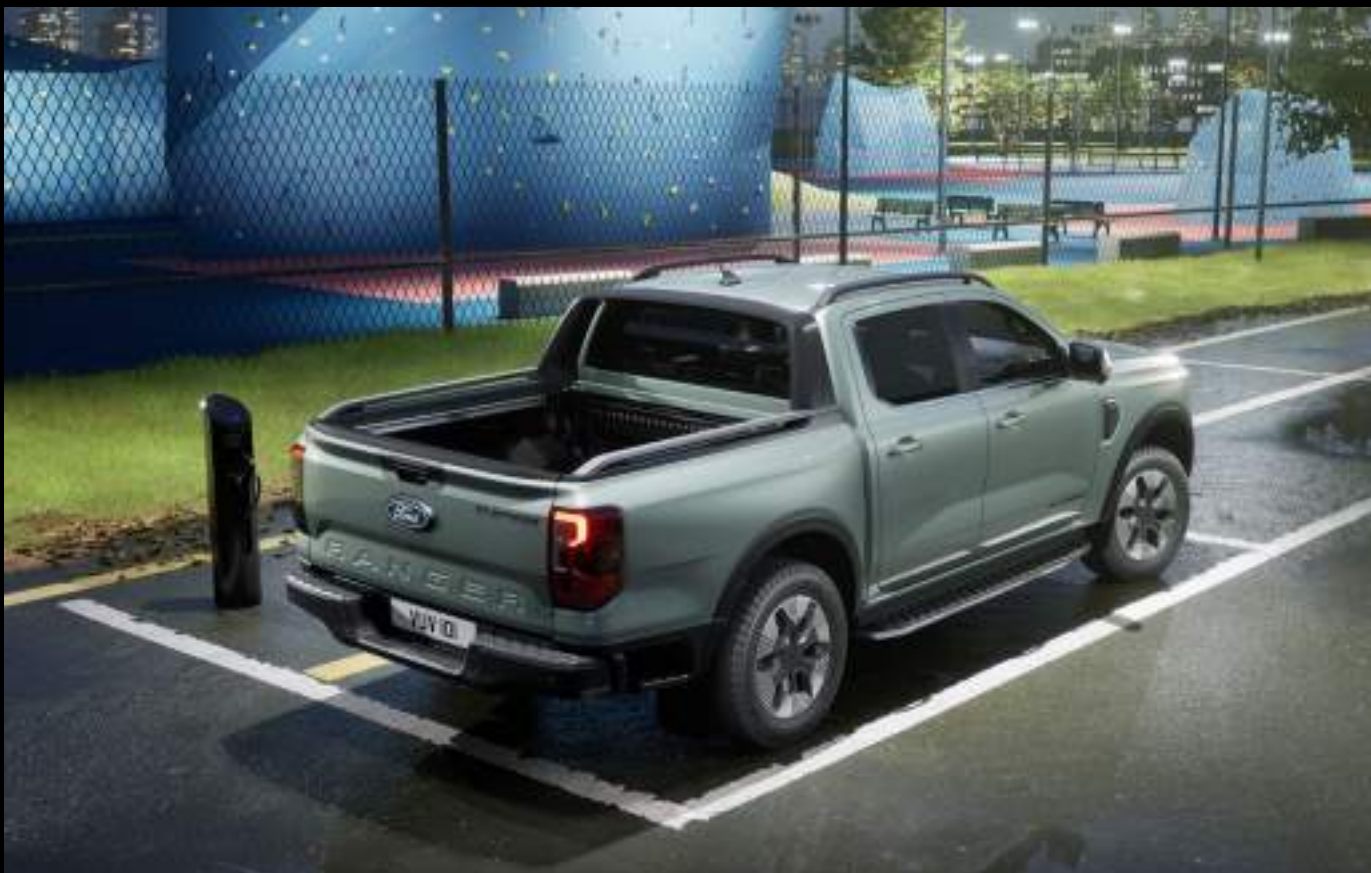
Ford Ranger w wersji Platinum z napędem PHEV. Kolor nadwozia Acacia Green (lakier dostępny tylko dla wersji Platinum - wymaga dopłaty)

Technologia hybrydowa w Fordzie Ranger pozwala na osiągnięcie zerowej emisji podczas jazdy w trybie elektrycznym EV Now. Najlepiej sprzedający się pick-up w Europie właśnie stał się jeszcze lepszy. Masz do dyspozycji bezkompromisową, kultową wytrzymałość i zdolność do ciężkiej pracy Forda Ranger.