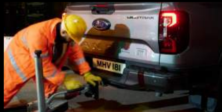
Maksymalna masa ciągniętej przyczepy to aż 3500 kg

Wyposażenie standardowe wersji Limited, Wildtrak i Platinum