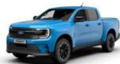
MS-RT BLUE 3 700 zł