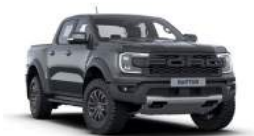
METEOR GREY - lakier metalizowany 3 200 zł