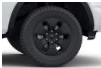
17" obrycze kół ze stopów lekkich (D2YF2) XLT PHEV