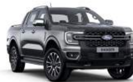
CARBONIZED GREY - lakier metalizowany 3 200 zł