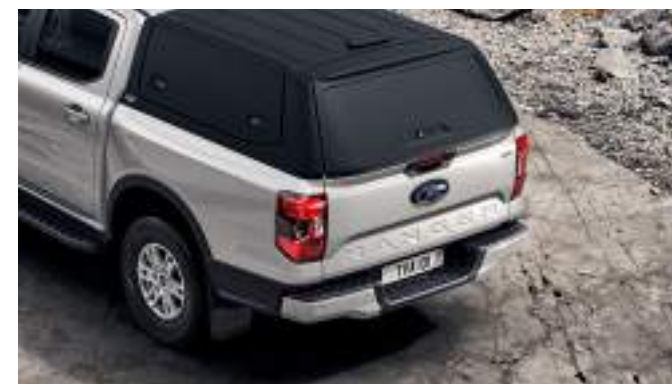
Hardtop bez okiem w kolorze „czarny mat” 16 200 zł dla wszystkich wersji w wyjątkiem wersji MS-RT i Raptor