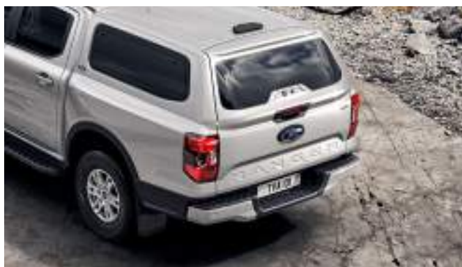
Hardtop z oknami w trzech kolorach nadwozia 17 200 zł dla wszystkich wersji w wyjątkiem wersji MS-RT i Raptor W kolorze nadwozia dla kolorów: Frozen White, Carbonized Grey, Agate Black. Dla pozostałych kolorów nadwozia Hardtop w kolorze czarnym Agate Black.