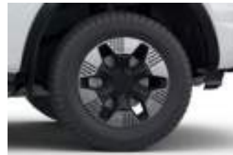
18" obrycze kół ze stopów lekkich (D2ULD) PLATINUM PHEV