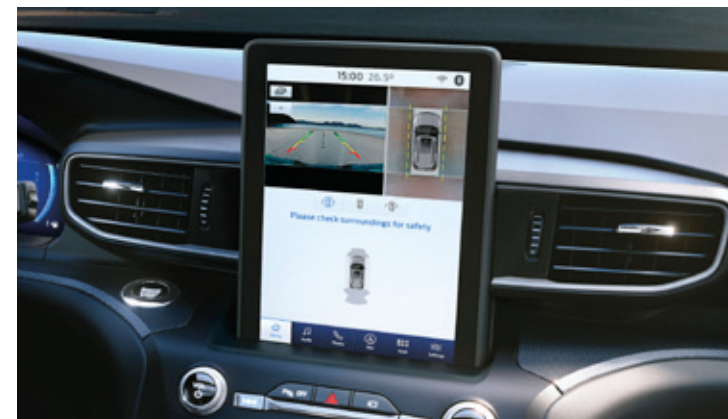
SYSTEM KAMER 360 STOPNI Standard dla wszystkich wersji