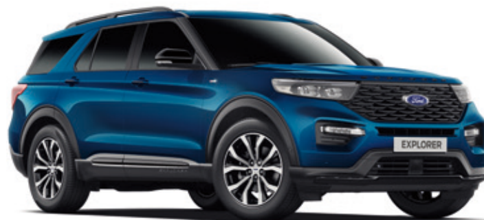
ATLAS BLUE - LAKIER METALIZOWANY 3 800,- | niedostępny dla wersji PLATINUM