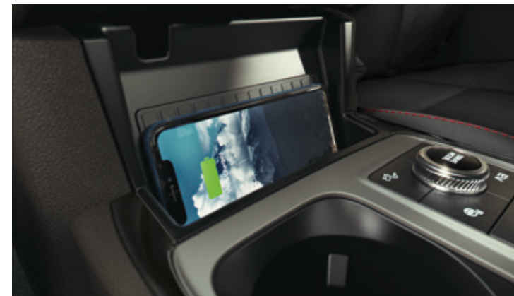
BEZPRZEWODOWA ŁADOWARKA Standard dla wszystkich wersji