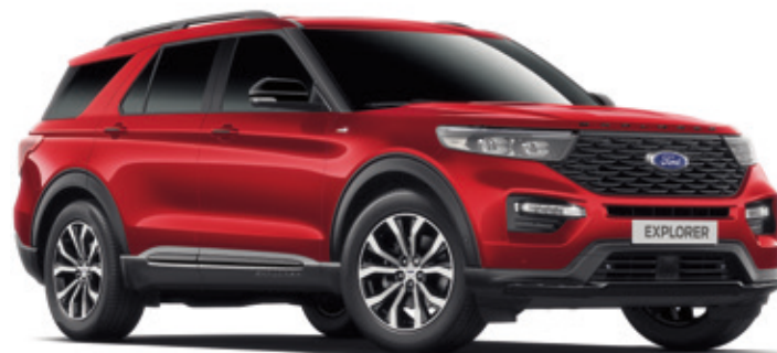
LUCID RED - LAKIER METALIZOWANY 4 700,- | 900,- dla wersji PLATINUM