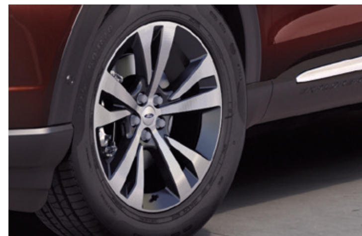
20" OBRĘCZE KÓŁ ZE STOPÓW LEKKICH Standard dla wersji ST-LINE