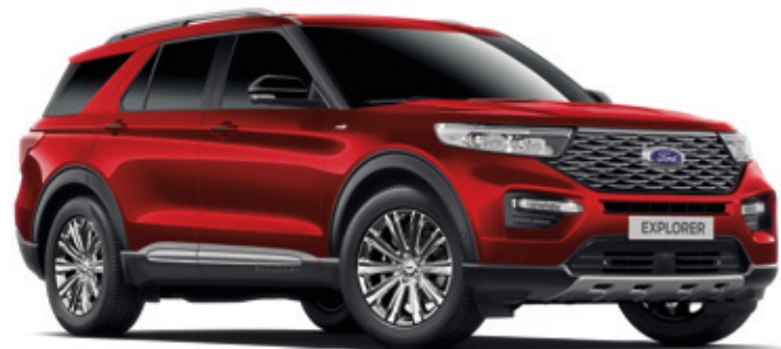
JEWEL RED- LAKIER METALIZOWANY bez dopłaty | lakier dostępny tylko dla wersji PLATINUM