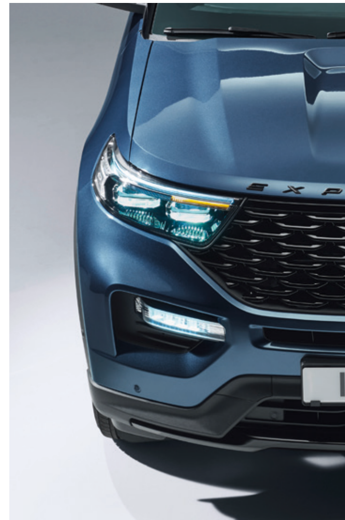
FORD EXPLORER | ST-LINE | LAKIER FLIGHT BLUE (OPCJA)