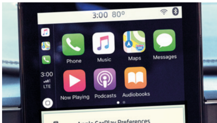
OBSŁUGA APPLE CARPLAY I ANDROID AUTO Standard dla wszystkich wersji