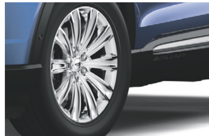
20" OBRĘCZE KÓŁ ZE STOPÓW LEKKICH W KOLORZE CHROMU Standard dla wersji PLATINUM