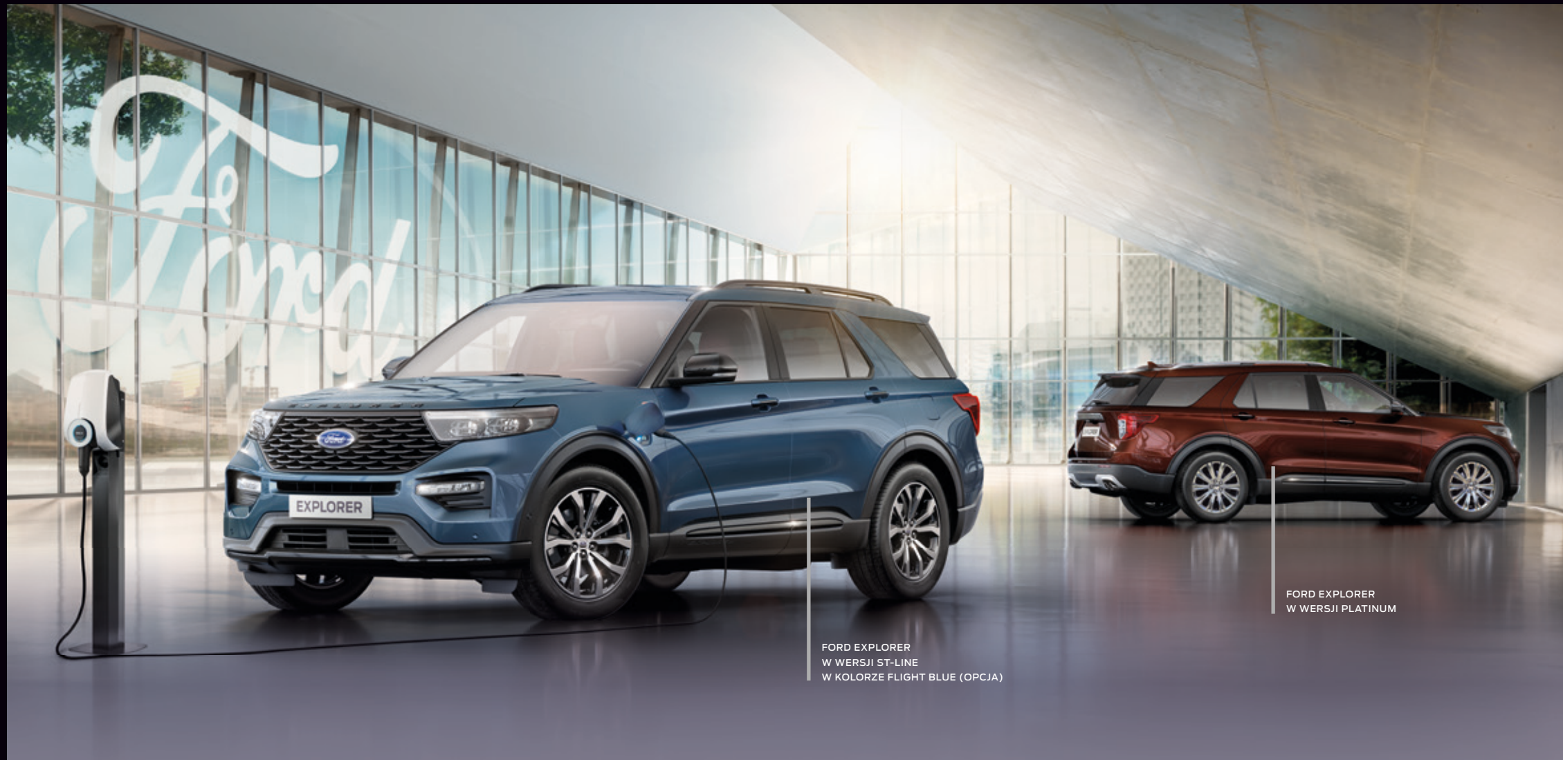
FORD EXPLORER W WERSJI ST-LINE W KOLORZE FLIGHT BLUE (OPCJA)