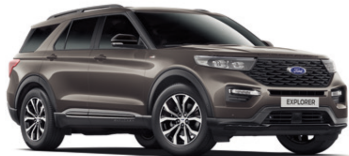
CARBONIZED GREY - LAKIER METALIZOWANY 4 700,- | 900,- dla wersji PLATINUM