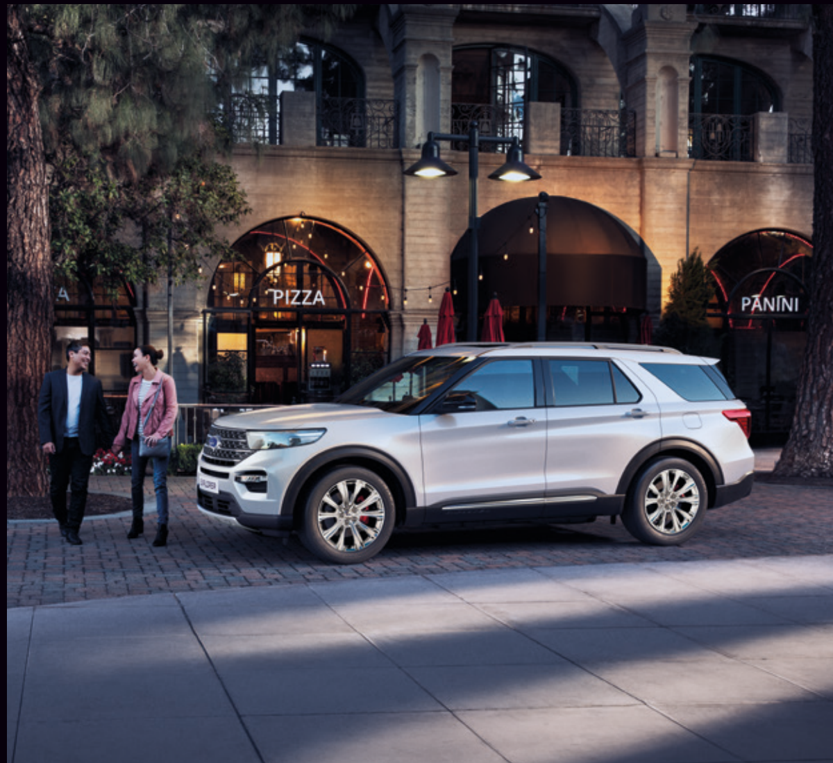
FORD EXPLORER | PLATINUM | KOLOR NADWOZIA STAR WHITE (OPCJA)

Wyraź siebie wybierając jeden z elektryzujących lakierów Forda Explorer