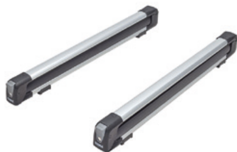
THULE®* PRYZSTAWKA UMOŻLIWIĄJĄCA PRZEWÓZ NART SNOWPACK 7326 (2 117 636) 999 PLN