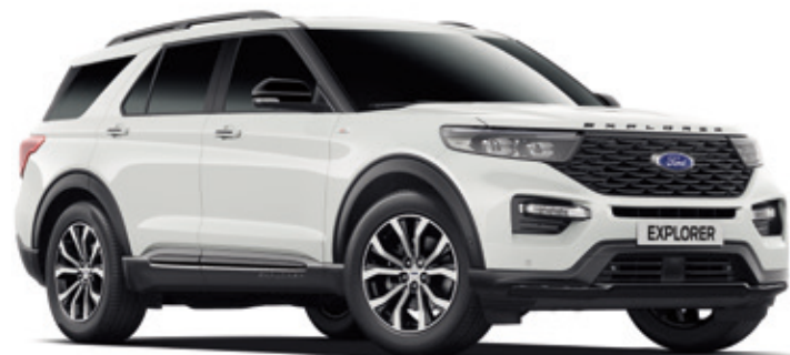
OXFORD WHITE - LAKIER ZWYKŁY bez dopłaty | niedostępny dla wersji PLATINUM