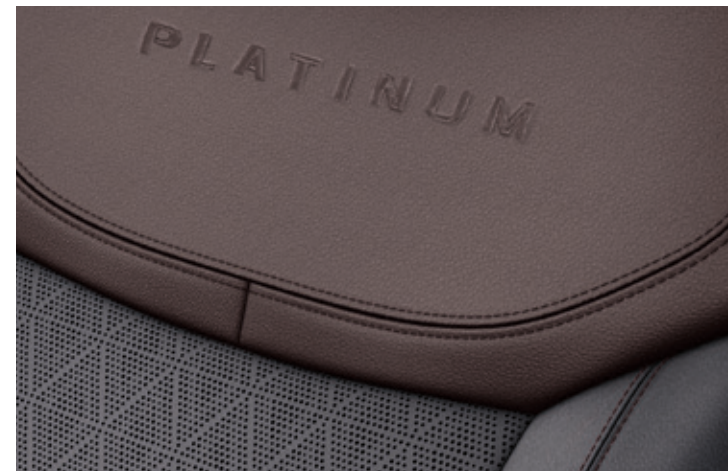
TAPICERKA SKÓRZANA, PERFOROWANA Z LOGO PLATINUM Standard dla wersji PLATINUM