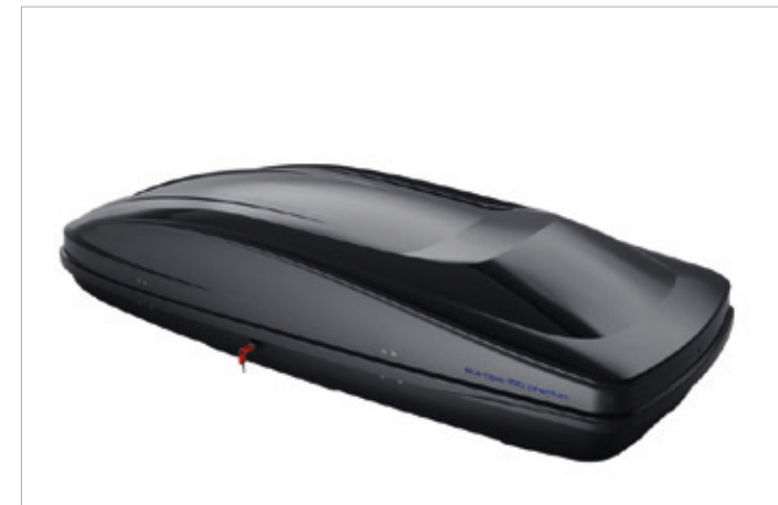
G3 BOX DACHOWY ELEGANCE EUROPE 339 PREMIUM (2 371 157) 1 353 PLN