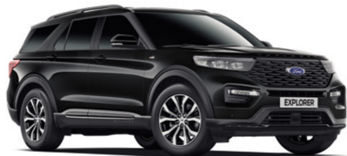
AGATE BLACK - LAKIER METALIZOWANY 3 800,- | bez dopłaty dla wersji PLATINUM