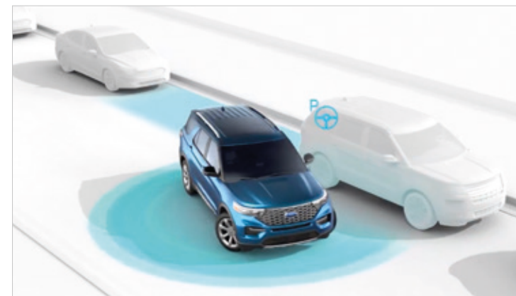
ACTIVE PARK ASSIST 2 Standard dla wszystkich wersji