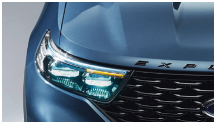
REFLEKTORY W TECHNOLOGII LED Standard dla wszystkich wersji