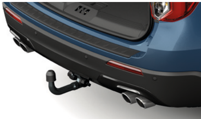
HAK HOLOWNICZY - DEMONTOWALNYM 5 500,-