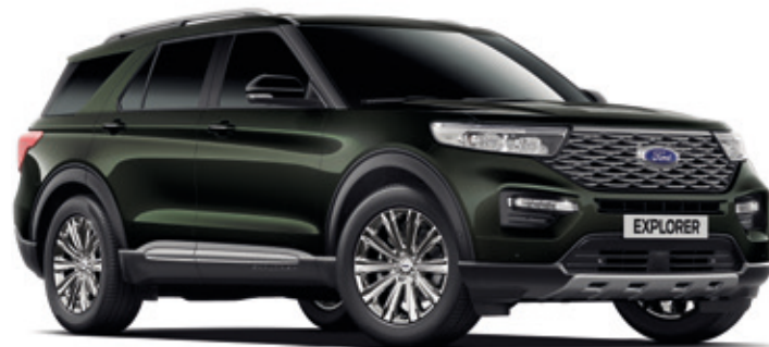
FORGED GREEN- LAKIER METALIZOWANY 900,- | lakier dostępny tylko dla wersji PLATINUM