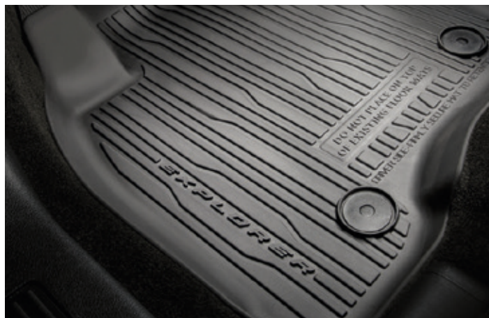
DYWANIKI PODŁOGOWE, GUMOWE - PRZEDNIE I TYLNE, CZARNE (2 328 965) 702 PLN