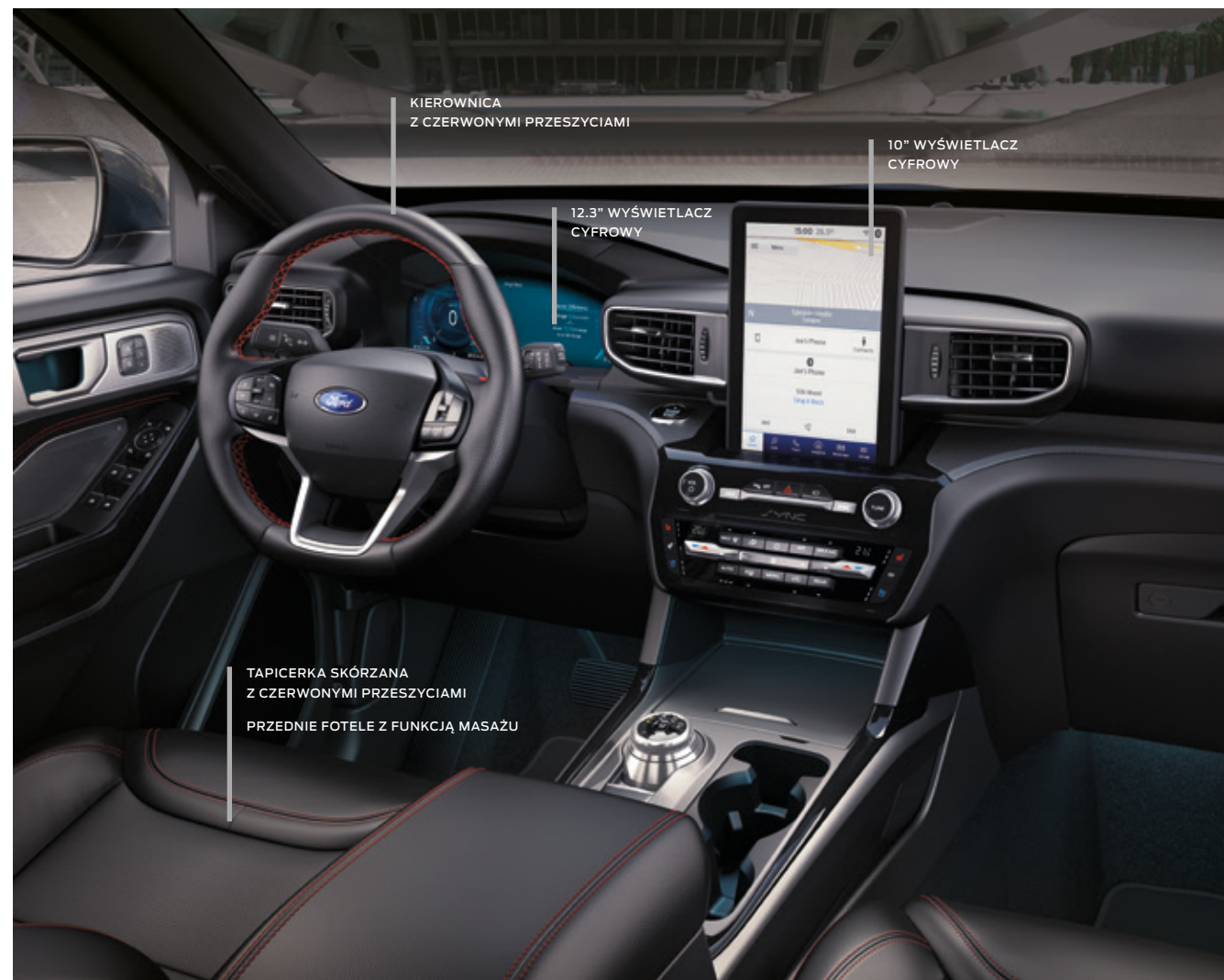
FORD EXPLORER | ST-LINE