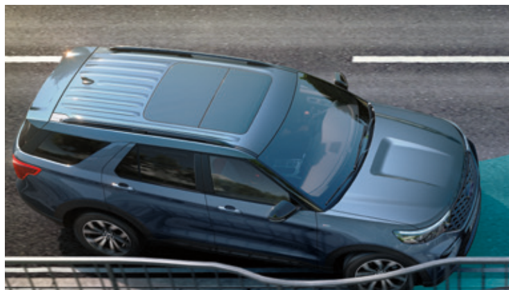
DACH PANORAMICZNY - OTWIERANY Standard dla wszystkich wersji