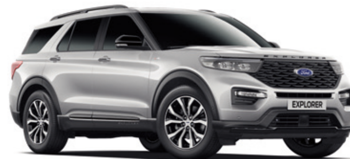
ICONIC SILVER - LAKIER METALIZOWANY 3 800,- | bez dopłaty dla wersji PLATINUM