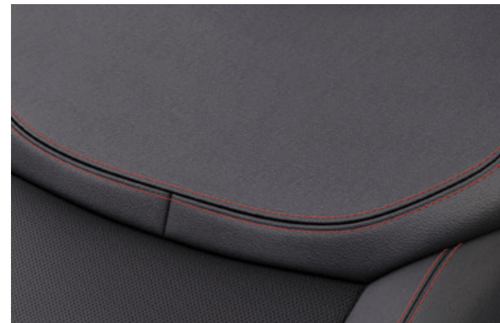
TAPICERKA SKÓRZANA Z CZERWONYMI PRZESZYCIAMI Standard dla wersji ST-LINE