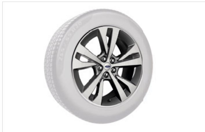
KOMPLET 20" OBRĘCZY KÓŁ ZE STOPÓW LEKKICH (2 400 644) DO MONTAŻU NIEZBĘDNE SĄ DODATKOWE ELEMENTY (NAKRĘTKI, KOŁPACZEK) 8 608 PLN