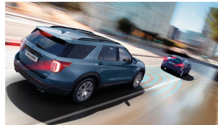
AKTYWNY TEMPOMAT Z FUNKCJĄ UTRZYMANIA POJAZDU NA ŚRODKU PASA RUCHU Standard dla wszystkich wersji