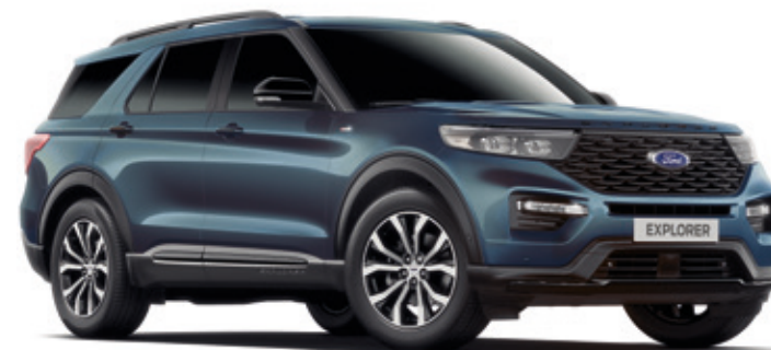
FLIGHT BLUE - LAKIER METALIZOWANY 3 800,- | bez dopłaty dla wersji PLATINUM