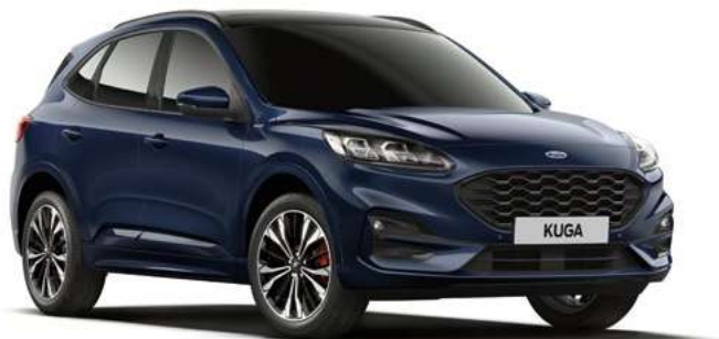
BLAZER BLUE - lakier zwykły bez dopłaty | niedostępny dla wersji Vignale