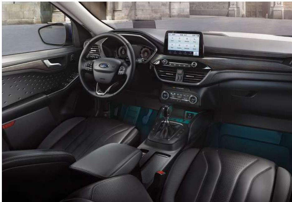
Nowy Ford Kuga Vignale