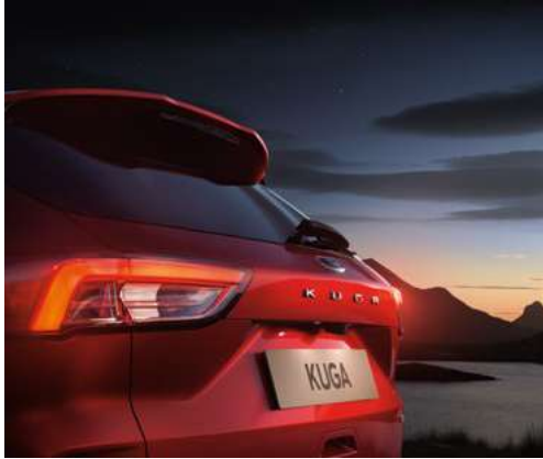
Duży, tylny spoiler lakierowany w kolorze nadwozia