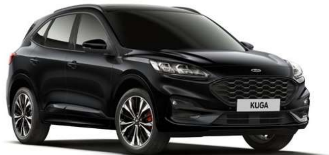
AGATE BLACK - lakier metalizowany 2 200,- | bez dopłaty dla wersji Vignale