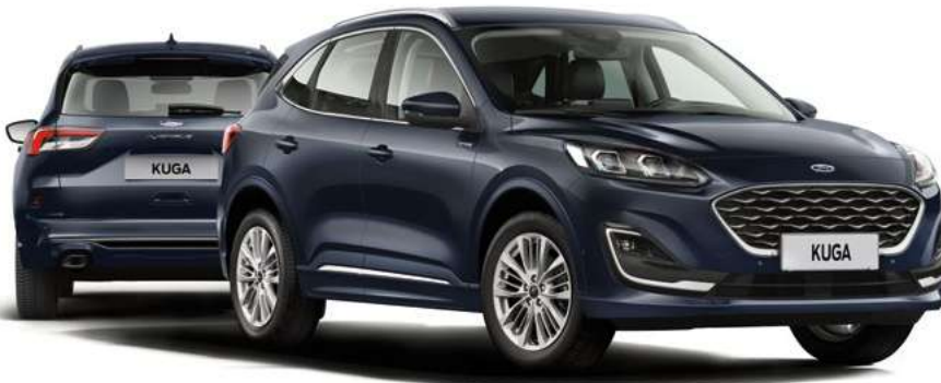
Nowy Ford Kuga ST-Line w kolorze Panther Black (opcja)