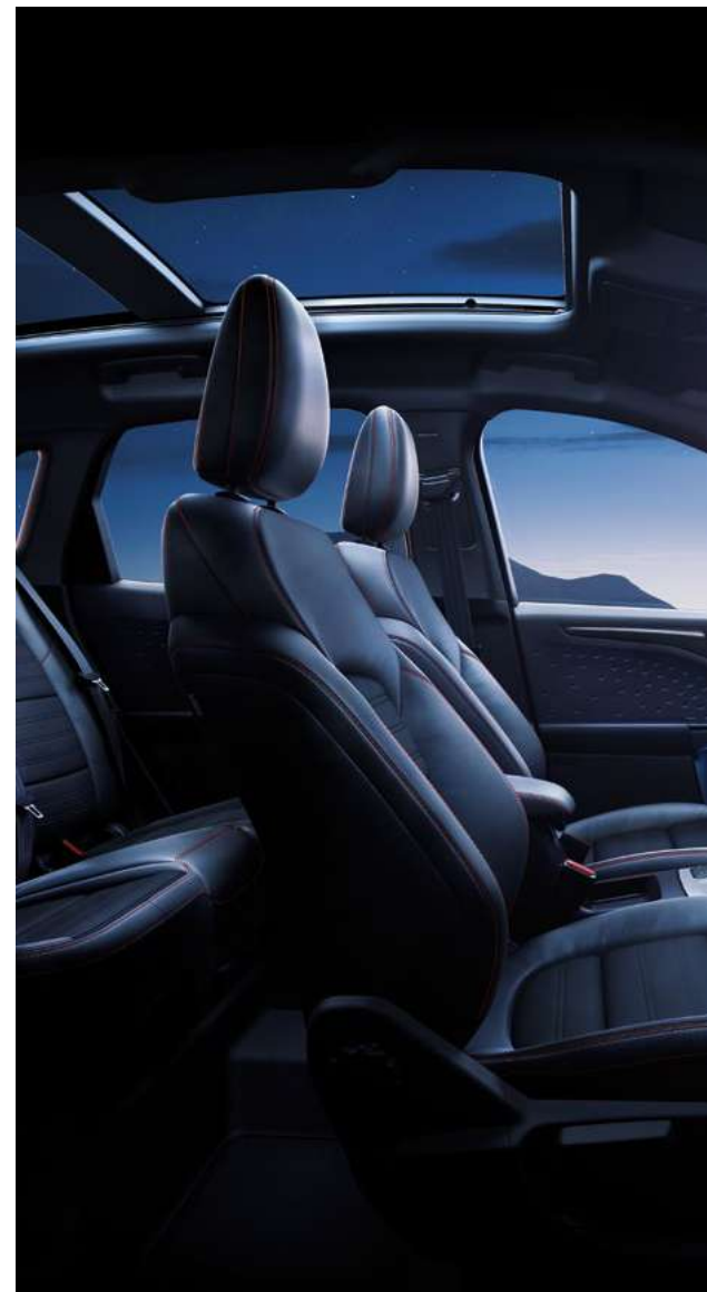
Nowy Ford Kuga ST-Line z pakietem X oraz opcjonalnym wyposażeniem