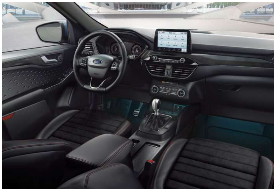
Nowy Ford Kuga ST-Line