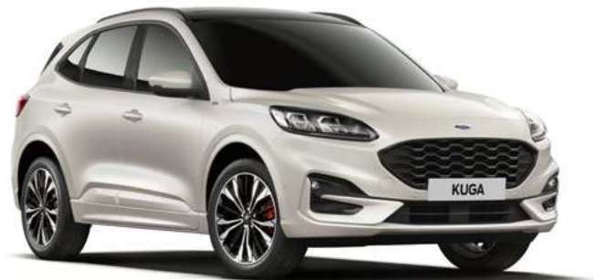
WHITE PLATNUM - lakier metalizowany specjalny 3 600,- | 1 400,- dla wersji Vignale | lakier niedostępny dla wersji Trend