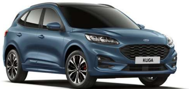
CHROME BLUE - lakier metalizowany 2 200,- | niedostępny dla wersji Vignale