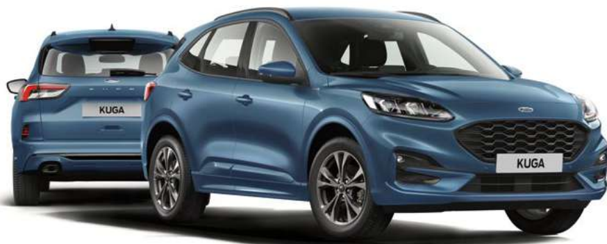
Nowy Ford Kuga ST-Line w kolorze Chrome Blue (opcja)