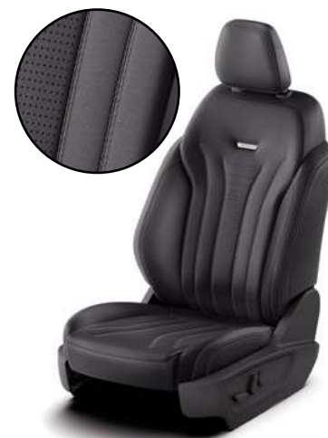
WINDSOR - tapicerka skórzana