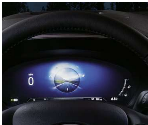
12.3" kolorowy wyświetlacz na tablicy zegarów