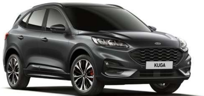
MAGNETIC GREY - lakier metalizowany 3 000,- | 800,- dla wersji Vignale