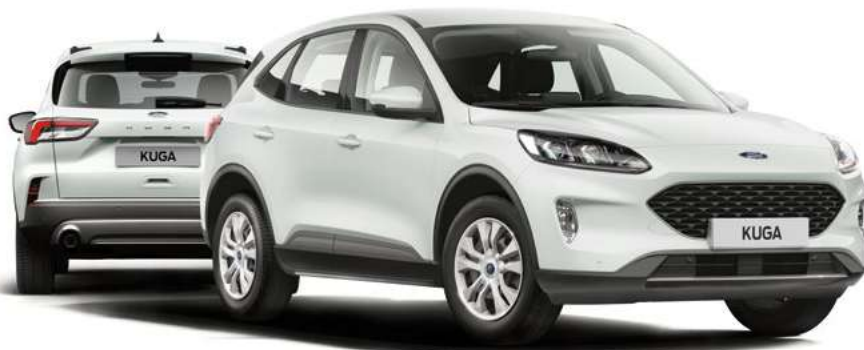
Nowy Ford Kuga Trend w kolorze Frozen White (opcja)