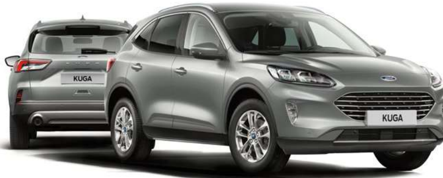
Nowy Ford Kuga Titanium w kolorze Solar Silver (opcja)