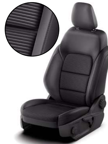
CUIR / SENSICO - tapicerka częściowo skórzana (skóra ekologiczna)