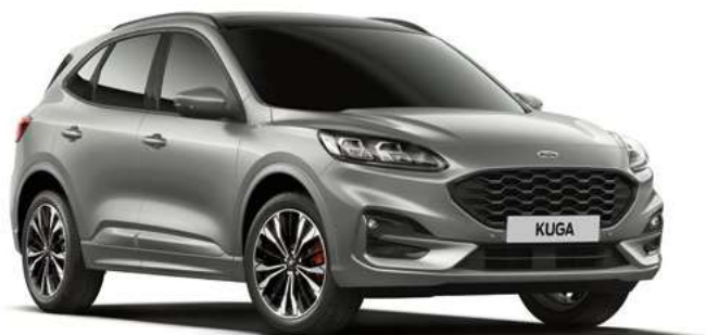
SOLAR SILVER - lakier metalizowany 2 200,- | bez dopłaty dla wersji Vignale