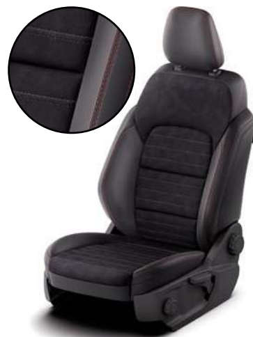
RAPTON / SENSICO - tapicerka częściowo skórzana (skóra ekologiczna) z czerwonymi akcentami