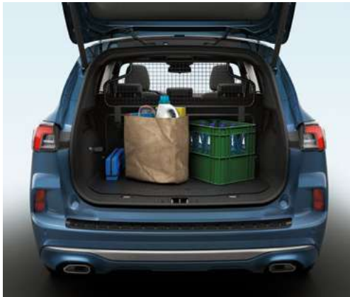
Drzwi bagażnika zamykane i otwierane elektrycznie i bezdotykowo