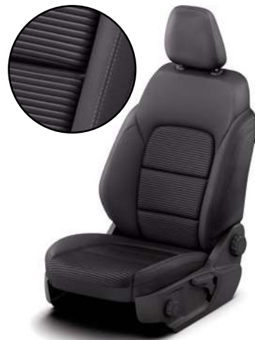
RAY - tapicerka materiałowa