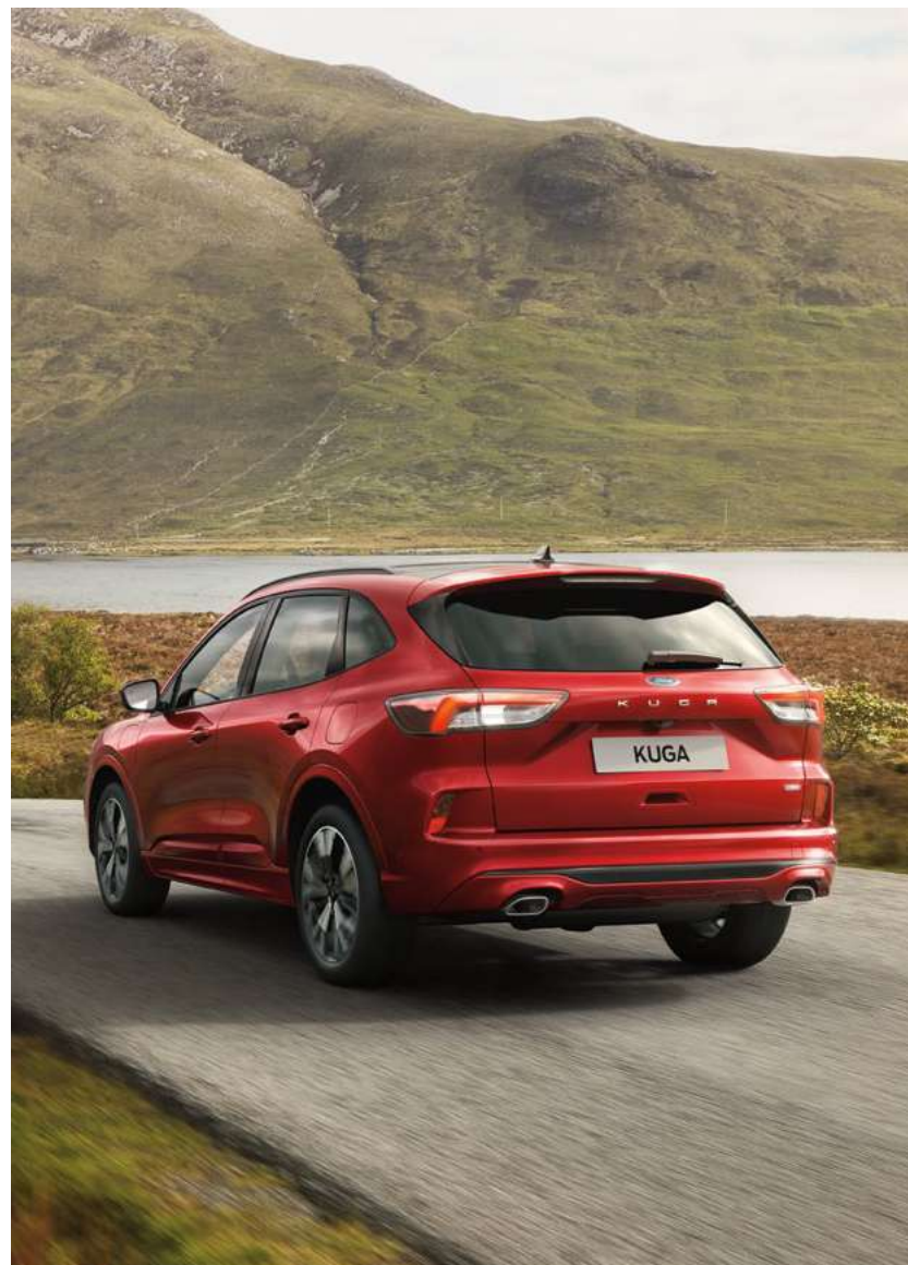
Nowy Ford Kuga ST-Line w kolorze Lucid Red (opcja)