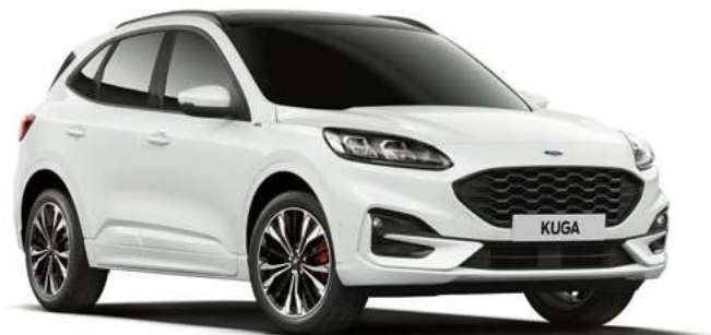
FROZEN WHITE - lakier zwykły 1 050,- | niedostępny dla wersji Vignale