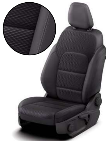
ZAHA - tapicerka materiałowa