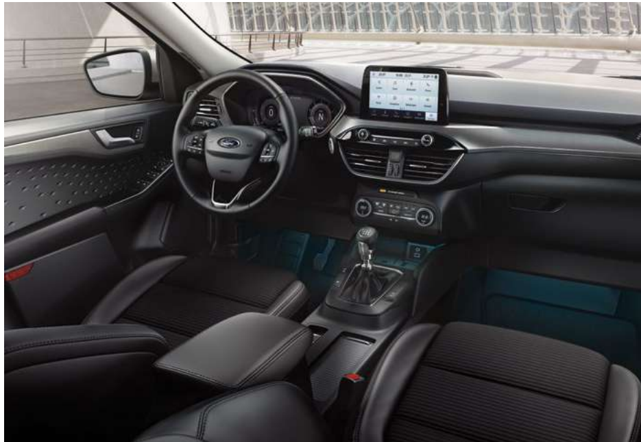
Nowy Ford Kuga Titanium