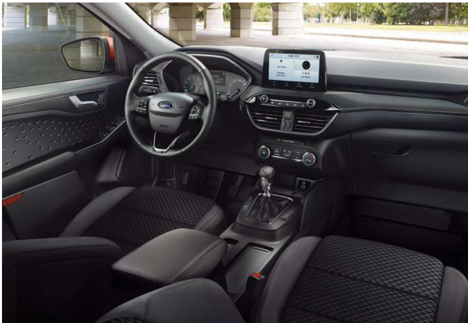
Nowy Ford Kuga Trend