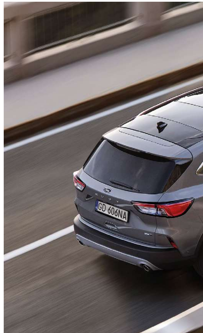
Nowy Ford Kuga Titanium w kolorze Solar Silver (opcja) oraz 18" obręczami kół ze stopów lekkich (opcja)

Sprawdź też ofertę Nowego Forda Kuga PLUG-IN HYBRID oraz Hybrid, dostępną w osobnym cenniku.