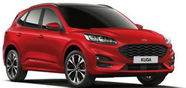
LUCID RED - lakier metalizowany specjalny 3 600,- | 1 400,- dla wersji Vignale