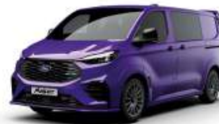
ENW PURPLE - LAKIER SVO

2 500 zł | lakier dostępny tylko dla wersji TREND i MS-RT