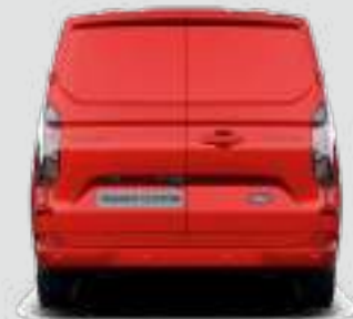
2040 - 2148 mm (ZE ZŁOŻONYMI LUSTERKAMI)