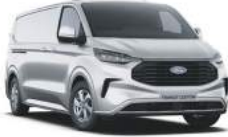
MOONDUST SILVER - LAKIER METALIZOWANY 2 750 zł | lakier niedostępny dla wersji MS-RT