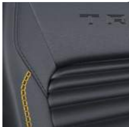
Ford Transit Custom VAN w wersji TRAIL z automatyczną skrzynią biegów i tapicerką częściowo skórzaną (Sensico) w stylizacji TRAIL - z żółtymi akcentami (standard)