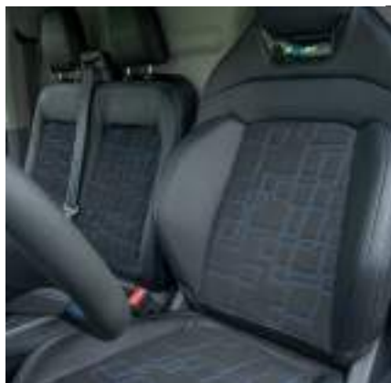
Ford Transit Custom VAN w wersji MS-RT z automatyczną skrzynią biegów i tapicerką częściowo skórzaną, połączone z zamsem (standard)