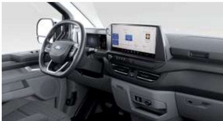
Ford Transit Custom VAN L1 w wersji LIMITED z automatyczną skrzynią biegów i tapicerką materiałową - ciemną (standard)