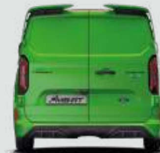
2275 mm (Z LUSTERKAMI)