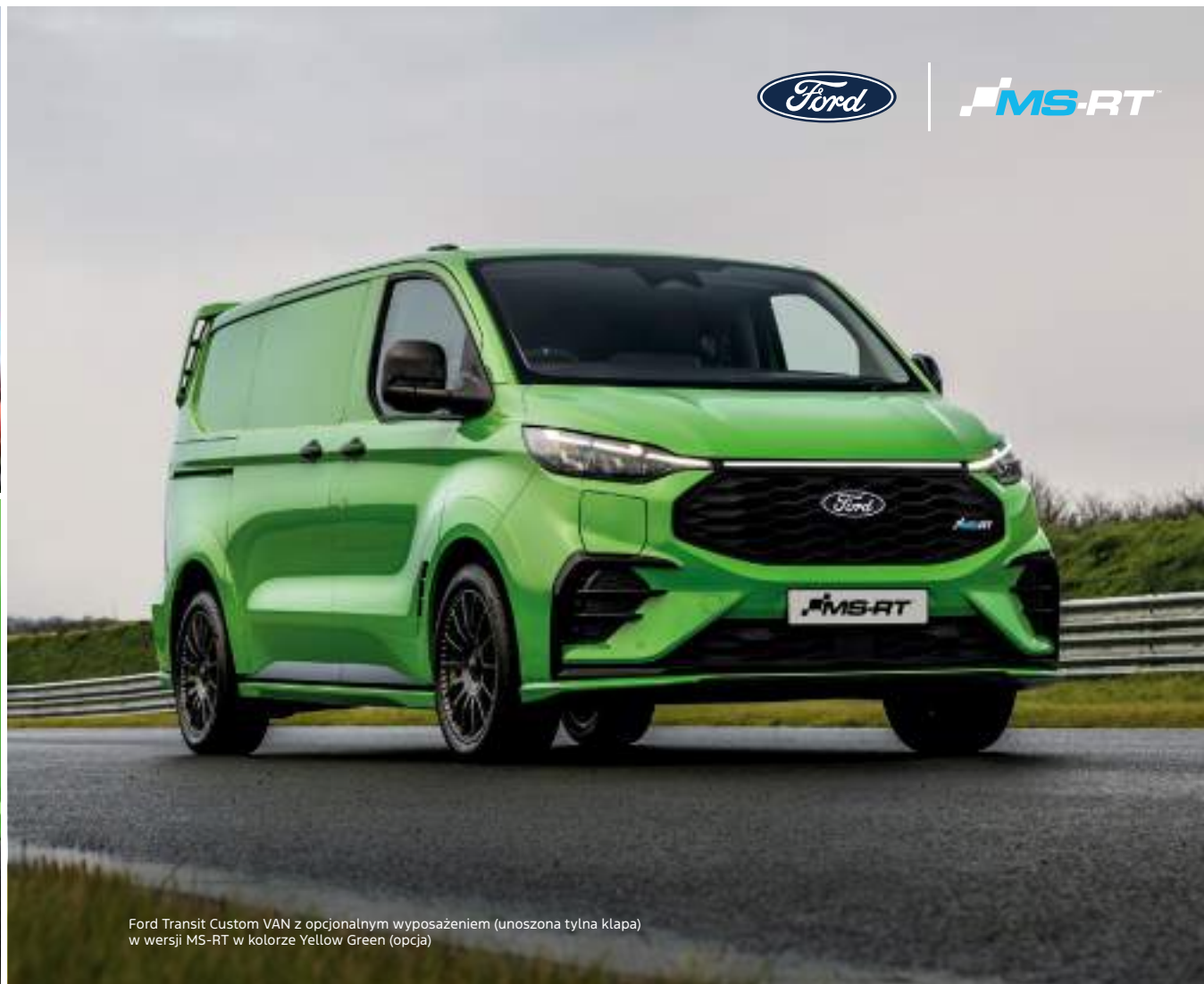
Ford Transit Custom VAN z opcjonalnym wyposażeniem (unoszona tylna klapa) w wersji MS-RT w kolorze Yellow Green (opcja)