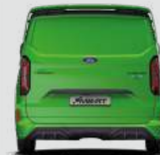
2148 mm (ZE ZŁOŻONYMI LUSTERKAMI)