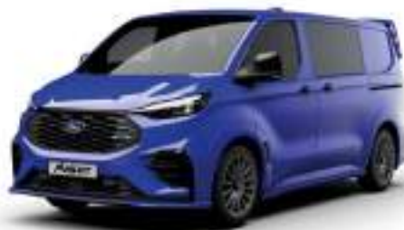
ULTRAMARINE BLUE - LAKIER SVO

2 500 zł | lakier dostępny tylko dla wersji TREND i MS-RT