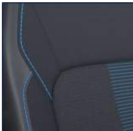
Ford Transit Custom VAN w wersji Sport z automatyczną skrzynią biegów i tapicerką częściowo skórzaną (Sensico) z niebieskimi akcentami (standard)