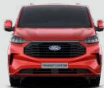
2275 mm (Z LUSTERKAMI)