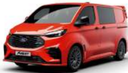
TNT TANGO ORANGE - LAKIER SVO

2 500 zł | lakier dostępny tylko dla wersji MS-RT