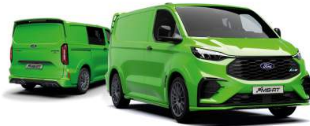
Ford Transit Custom VAN w wersji MS-RT z opcjonalnym wyposażeniem (unoszona tylna klapa) oraz lakierem specjalnym Yellow Green (opcja)