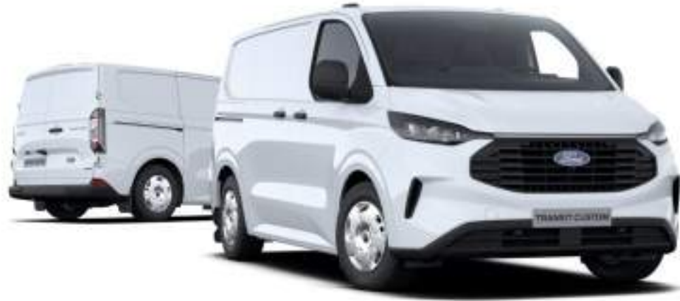
Ford Transit Custom VAN L1 w wersji Trend z lakierem zwykłym Frozen White (bez dopłaty)