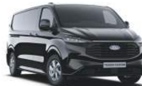
AGATE BLACK - LAKIER METALIZOWANY 2 750 zł