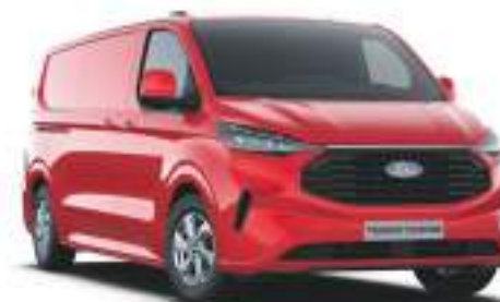
RACE RED - LAKIER ZWYKŁY bez dopłaty | lakier dostępny tylko dla wersji TREND