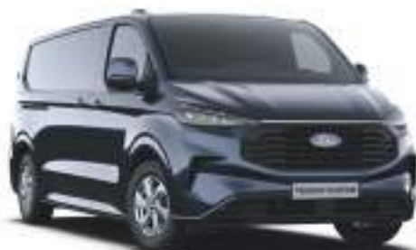
BLAZER BLUE - LAKIER ZWYKŁY bez dopłaty | lakier dostępny tylko dla wersji TREND