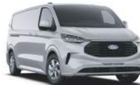
GREY MATTER - LAKIER ZWYKŁY SPECIALNY 2 750 zł | lakier niedostępny dla wersji TREND