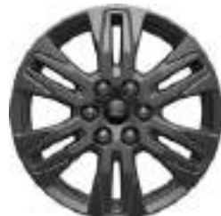
17" OBRĘCZE ZE STOPÓW LEKKICH 550 zł dla wersji LIMITED