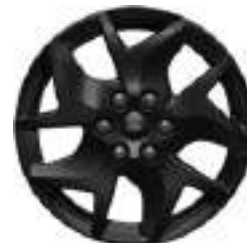
17" OBRĘCZE ZE STOPÓW LEKKICH Standard dla wersji SPORT