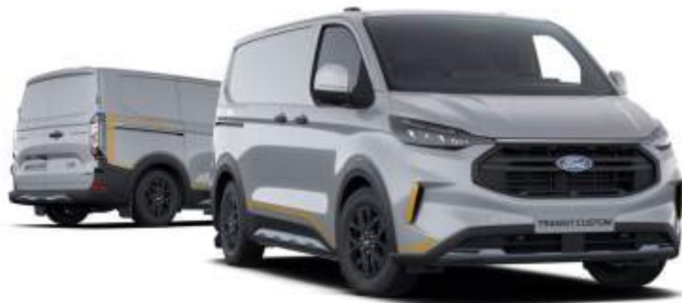
Ford Transit Custom VAN L1 w wersji TRAIL z lakierem zwykłym -specjalnym Grey Matter (opcja)