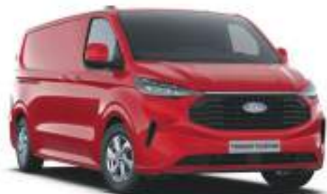
ARTISAN RED - LAKIER METALIZOWANY 2 750 zł | lakier niedostępny dla wersji TREND i TRAIL