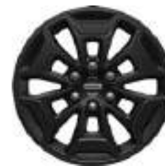
17" OBRĘCZE ZE STOPÓW LEKKICH 1 000 zł dla wersji TRAIL