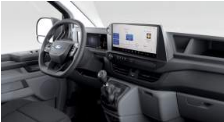
Ford Transit Custom VAN w wersji Trend z manualną skrzynią biegów i tapicerką materiałową - ciemną (standard)