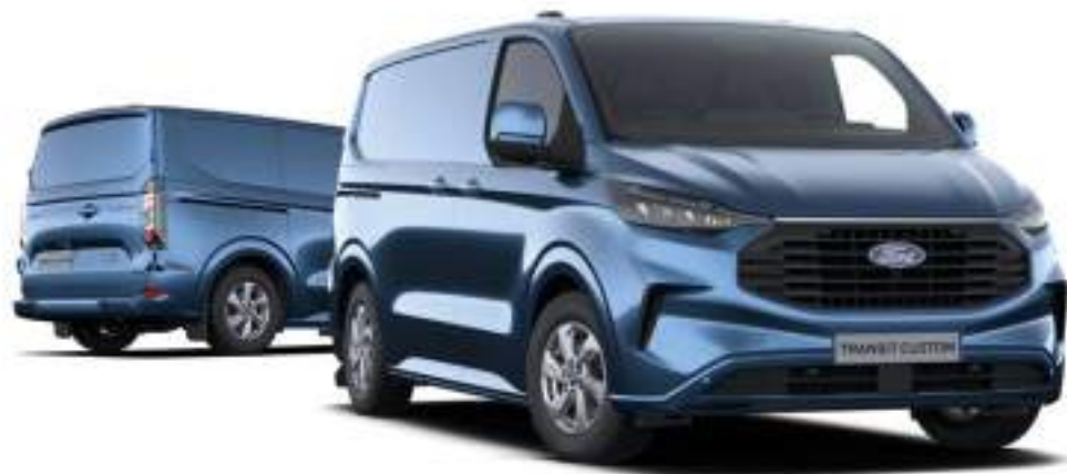
Ford Transit Custom VAN L1 w wersji LIMITED z lakierem metalizowany Chrome Blue (opcja)