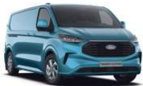
DIGITAL AQUA BLUE - LAKIER METALIZOWANY

2 750 zł | lakier niedostępny dla wersji TRAIL.