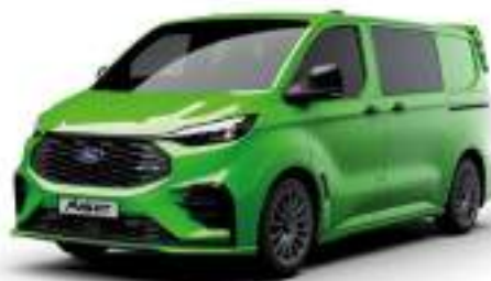
YELLOW GREEN - LAKIER SVO

Dla wersji TREND dostępny tylko z napędem elektrycznym