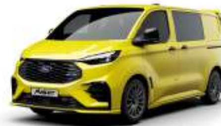
CADMIUM YELLOW - LAKIER SVO

2 500 zł | lakier dostępny tylko dla wersji TREND i MS-RT