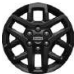
16" OBRĘCZE ZE STOPÓW LEKKICH Standard dla wersji TRAIL