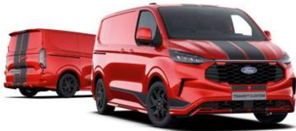
Ford Transit Custom VAN w wersji Sport z lakierem metalizowanym Artisan Red (opcja)