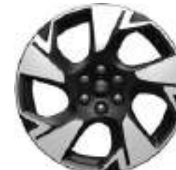
19" OBRĘCZE ZE STOPÓW LEKKICH 1000 zł dla wersji SPORT