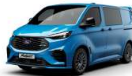
MS-RT BLUE - LAKIER SVO

2 500 zł | lakier dostępny tylko dla wersji TREND i MS-RT