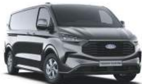
MAGNETIC GREY - LAKIER METALIZOWANY 2 750 zł