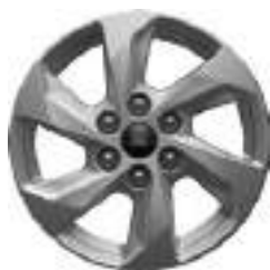
16" OBRĘCZE ZE STOPÓW LEKKICH 450 zł dla wersji TREND Standard dla wersji LIMITED