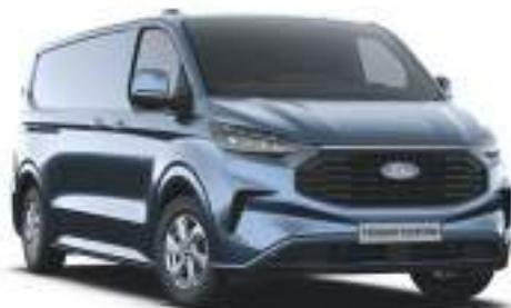
CHROME BLUE - LAKIER METALIZOWANY 2 750 zł | lakier niedostępny dla wersji TRAIL i MS-RT