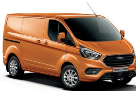
ORANGE GLOW - lakier metalizowany 2 500,-