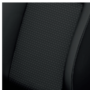
CAPITOL - Tapicerka materiałowa