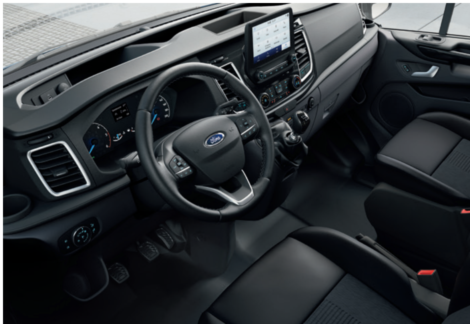
Ford Transit Custom VAN Active