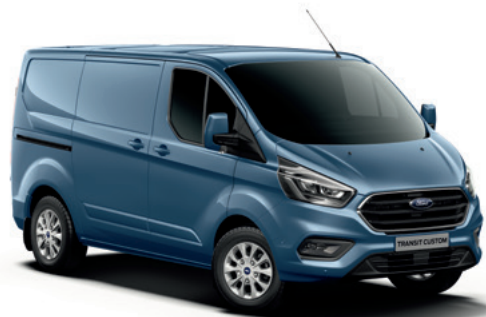
CHROME BLUE - lakier metalizowany 2 500,-