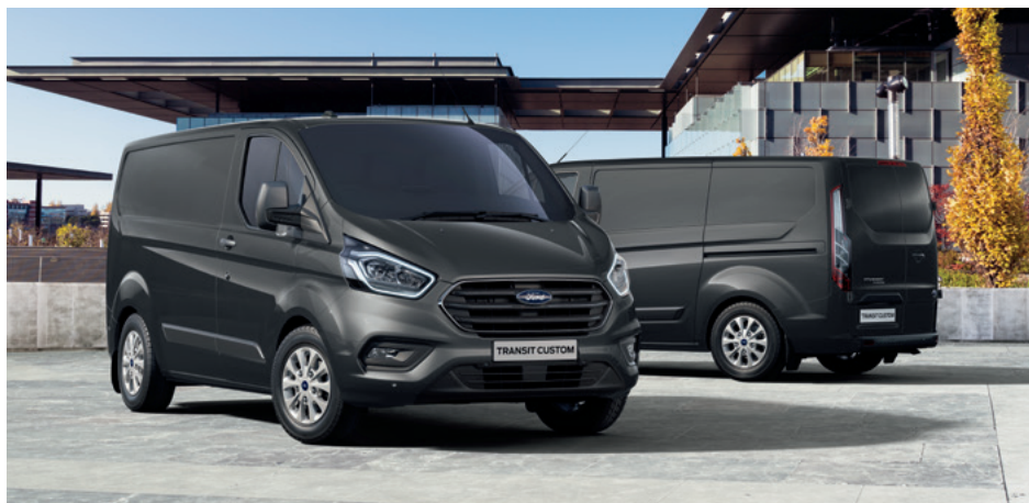
Ford Transit Custom VAN Limited w kolorze Magnetic Grey (opcja)