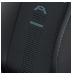
SALERNO - Tapicerka częściowo skórzana