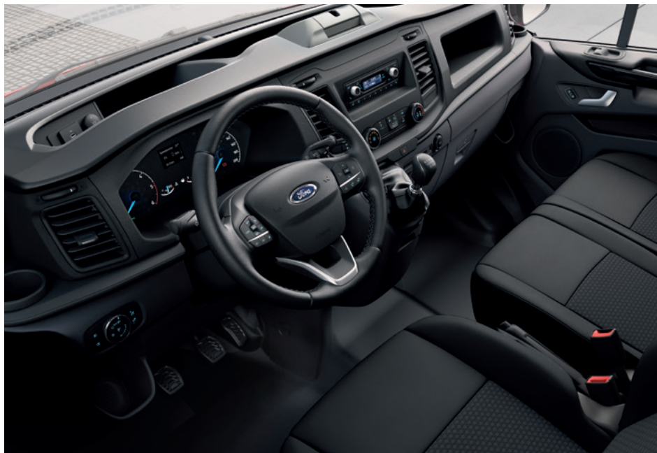
Ford Transit Custom VAN Trend