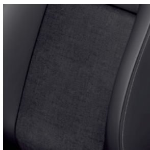
INROAD - Tapicerka materiałowa