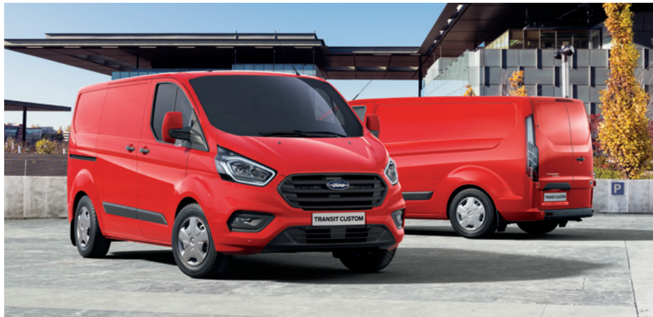
Ford Transit Custom VAN Trend w kolorze Race Red (bez dopłaty)