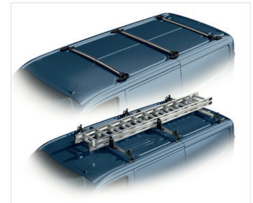
ZINTEGROWANY BAGAŻNIK DACHOWY - SKŁADANY