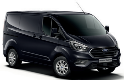
AGATE BLACK - lakier metalizowany 2 500,-