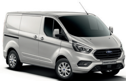
MOONDUST SILVER - lakier metalizowany 2 500,-