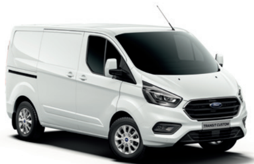
FROZEN WHITE - lakier zwykły bez dopłaty