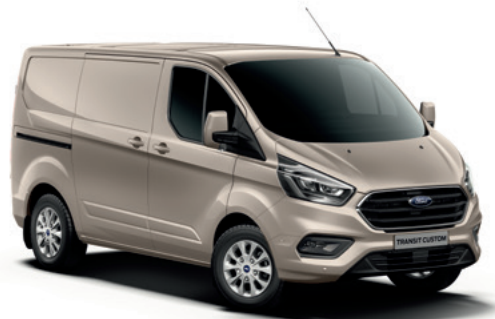
DIFFUSED SILVER - lakier metalizowany 2 500,-