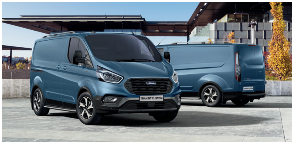
Ford Transit Custom VAN Active w kolorze Chrome Blue (bez dopłaty)