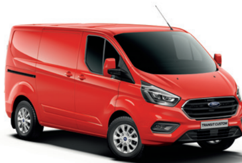
RACE RED - lakier zwykły bez dopłaty