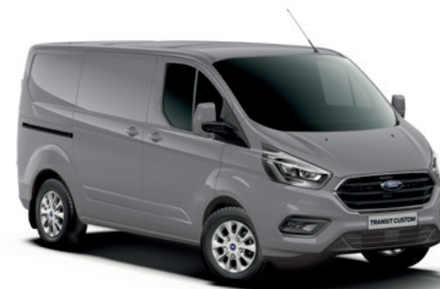
GREY MATTER - lakier specjalny 2 500,-