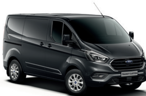
MAGNETIC GREY - lakier metalizowany 2 500,-