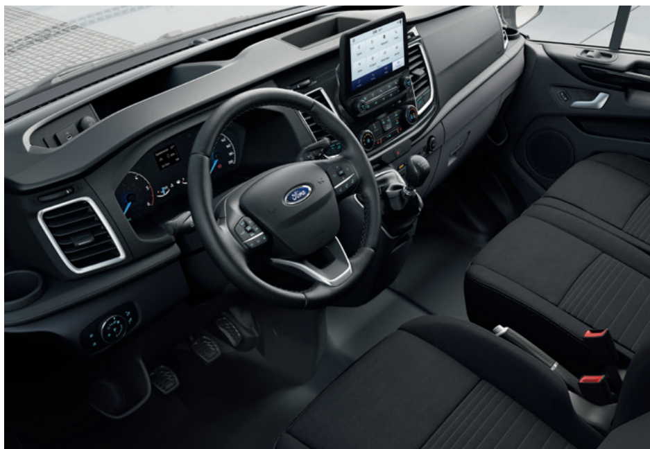
Ford Transit Custom VAN Limited