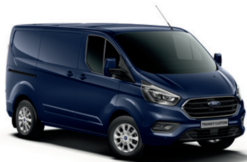
BLAZER BLUE - lakier zwykły bez dopłaty